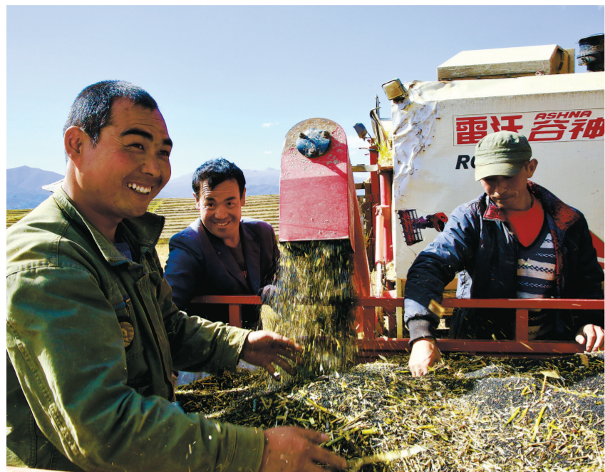
智慧农机开进田间地头。