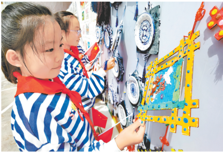
动。各界党员群众积极开展党史学习教育活