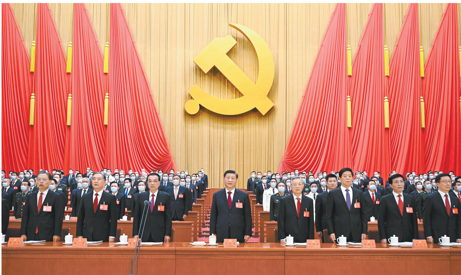
10月16日,中国共产党第二十次全国代表大会在北京人民大会堂开幕。这是习近平、李克强、栗战书、汪洋、王沪宁、赵乐际、韩正、胡锦涛在主席台上。

新华社北京10月16日电 凝心聚力擘画复兴新蓝图,团结奋进创造历史新伟业。举世瞩目的中国共产党第二十次全国代表大会16日上午在人民大会堂开幕。