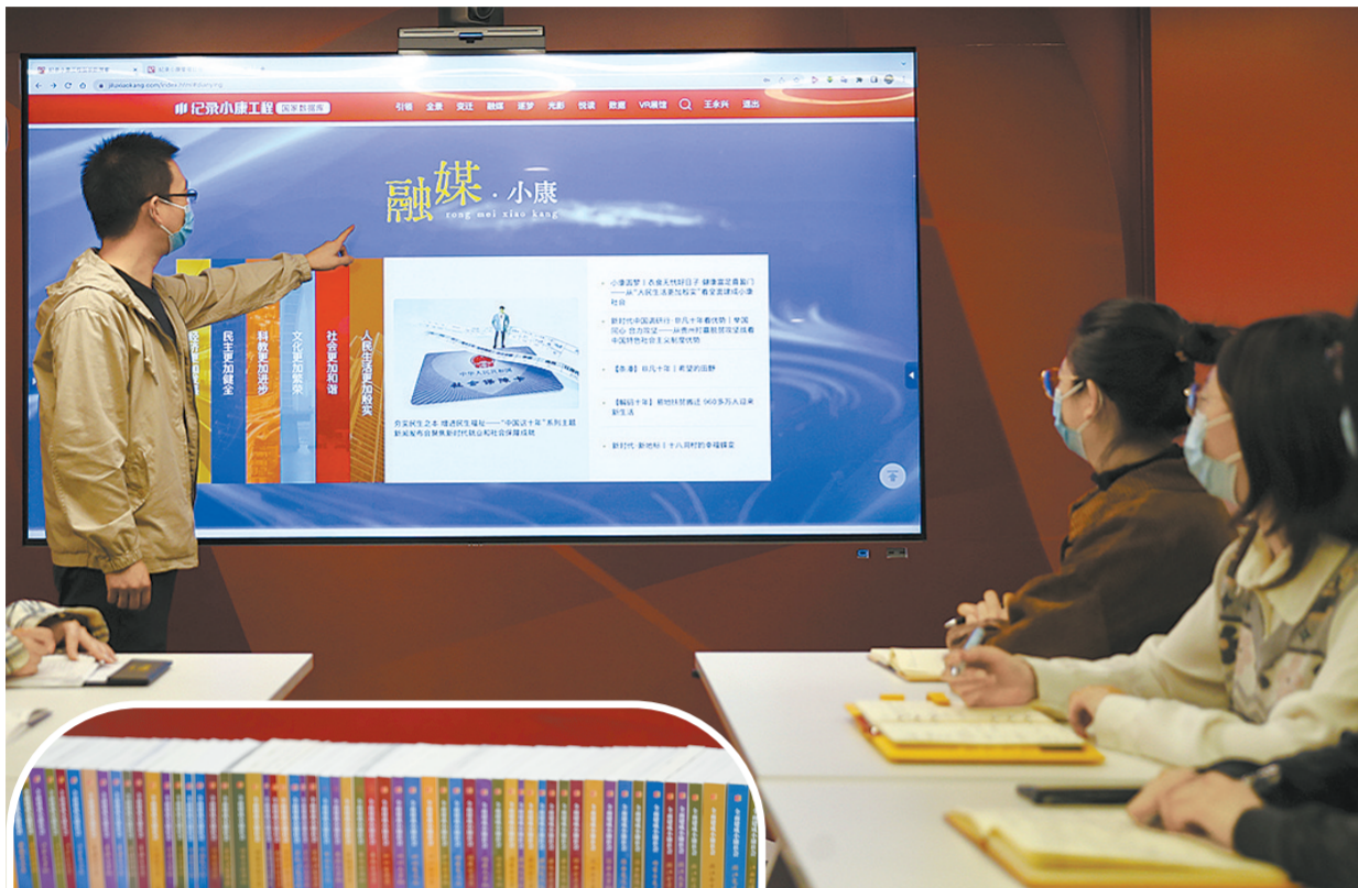
10月14日，“纪录小康工程”数据库工作人员在介绍“纪录小康工程”数据库。