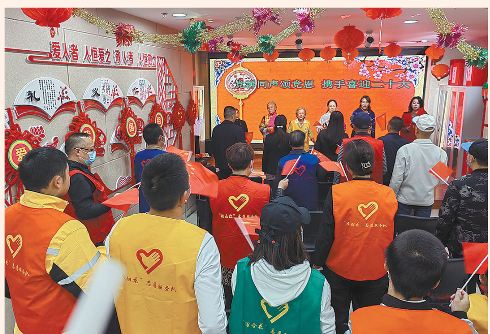
9月28日，西宁市城中区虎台街道虎台社区党委联合辖区青海省老干部活动中心、虎台卫生服务站举办“欢颂祖国 万寿无疆 翰墨飘香 喜迎二十大”主题党日活动，党员干部群众一起喜迎二十大和国庆节。活动现场，大家再次重温入党誓词、挥毫泼墨书写对祖国的祝福，把最美好的祝福献给党、献给祖国。