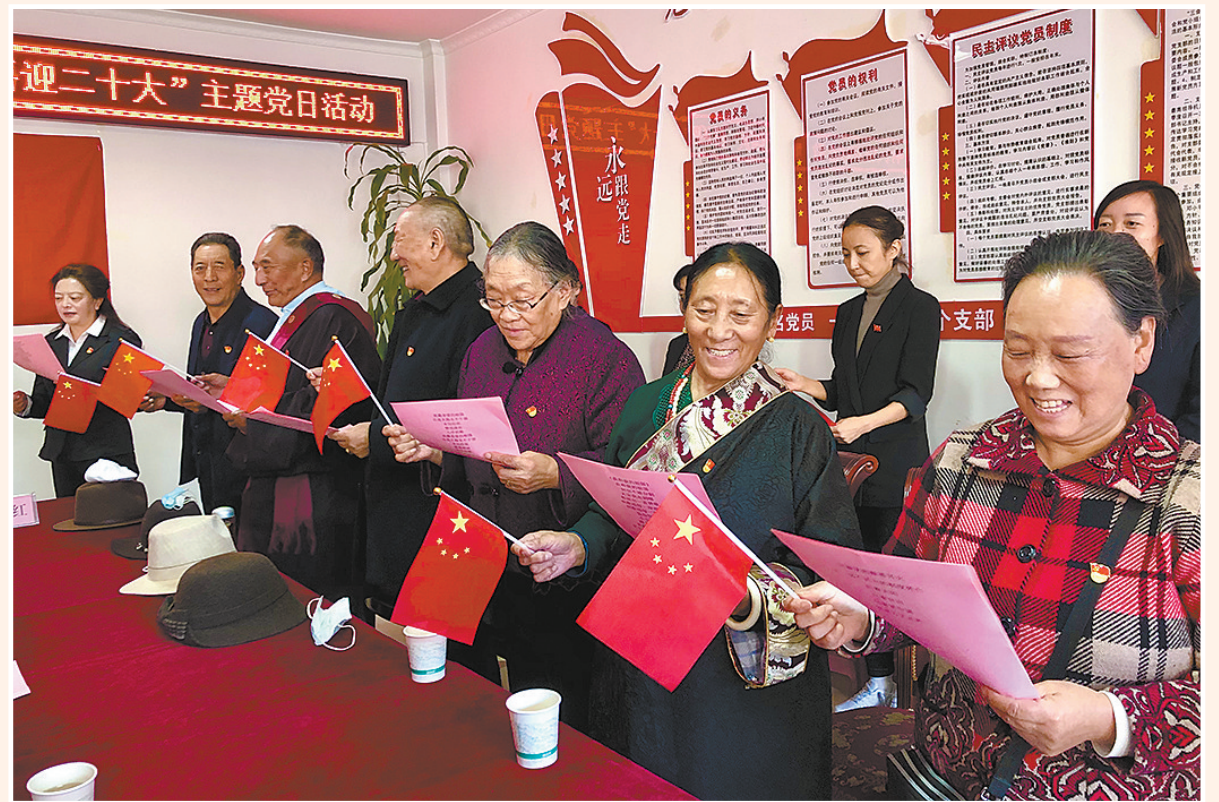
9月28日，在国庆节和重阳节来临之际，西宁市城中区西台社区党委联合玉树藏族自治州治多县驻宁干部所党支部开展了“唱响民族团结歌 携手庆国庆 喜迎二十大”主题党日活动，通过上党课、唱红歌、话重阳等形式，进一步加深党员干部民族团结一家亲意识，加强民族团结，增强民族团结凝聚力。