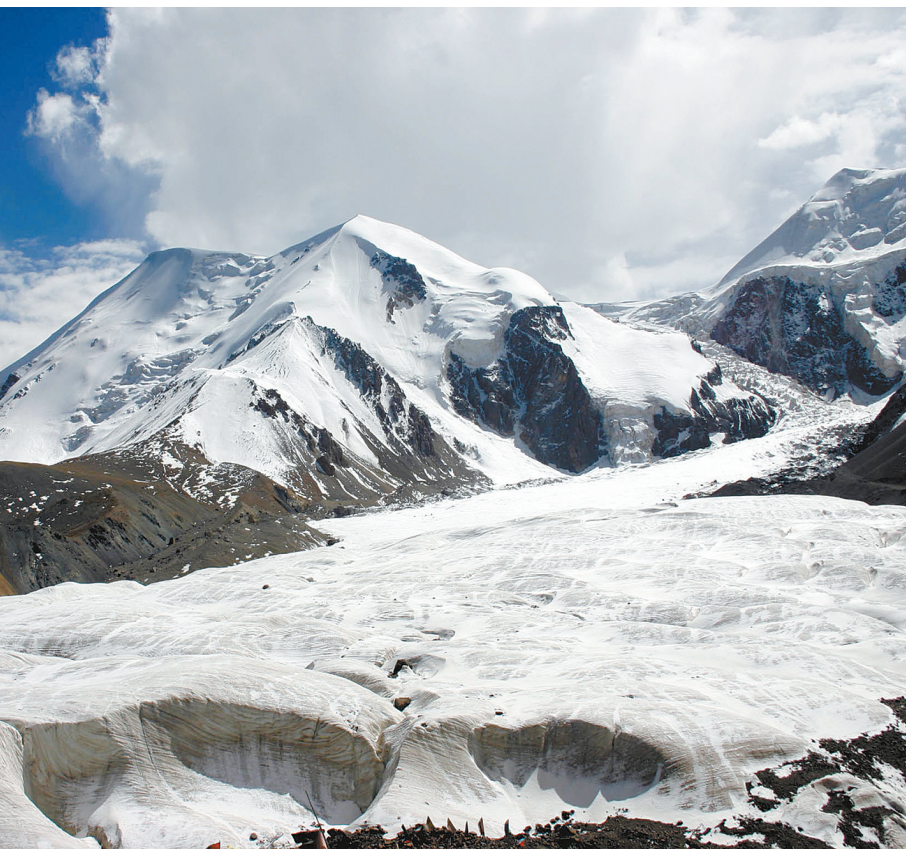
充满了神话色彩的阿尼玛卿雪山。

当然,最具灵性的还是孕育了大江大河的高原大山,正是这些终年白雪皑皑的巨峰,给了祖国母亲河以雷霆万钧的不竭动力。