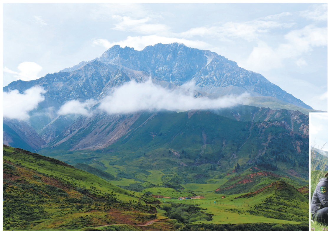
祁连山国家公园优美的自然风光。