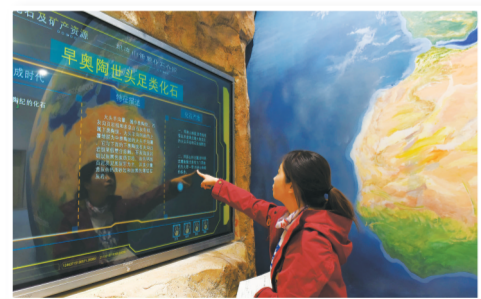
智能查看祁连山国家公园地质演变。