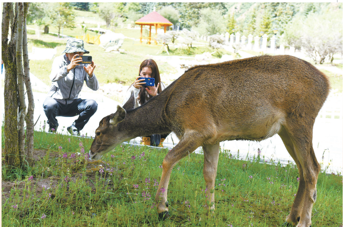
媒体记者与祁连山国家公园展陈中心所驻地内救助的一只白唇鹿互动。