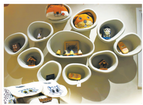
祁连山国家公园部分文创产品展示。