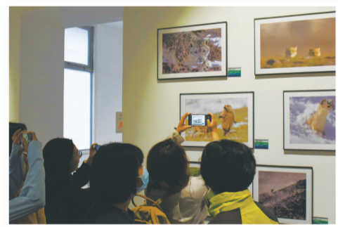
生态摄影作品吸引了众多媒体记者的目光。