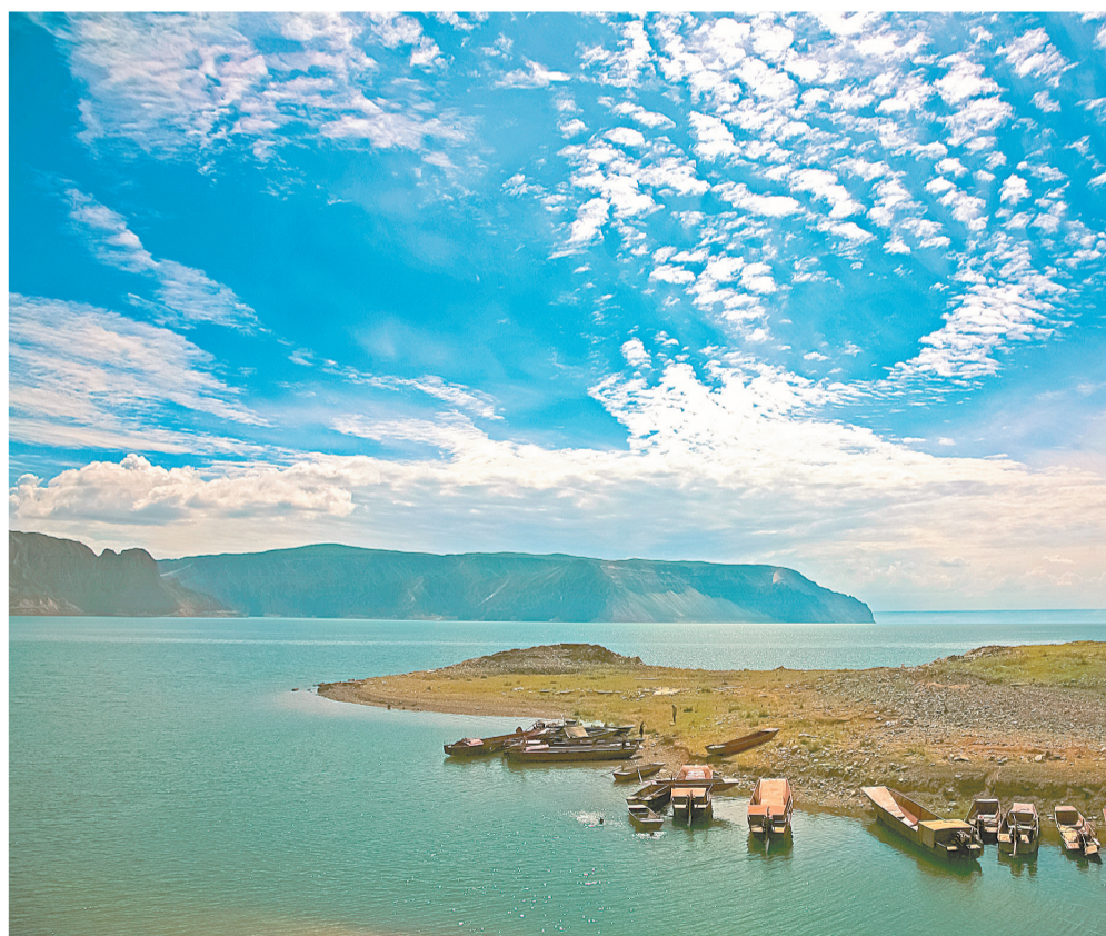
蓝天白云的映衬下,碧绿的龙羊湖更美丽。