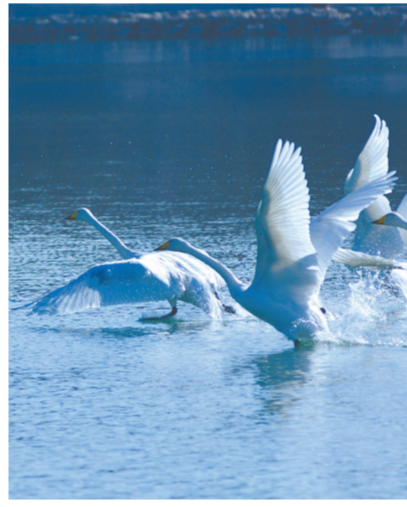
大天鹅来青海越冬。