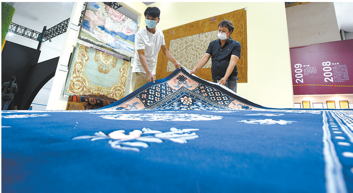
青海藏毯国际展览会在青海国际会展中心开幕。

本报讯（记者 王臻）7月22日，2022青海藏毯国际展览会在青海国际会展中心开幕。来自我省各成员单位相关人员、藏毯协会、省内藏毯企业和国内采购商代表近100人参加开幕式。