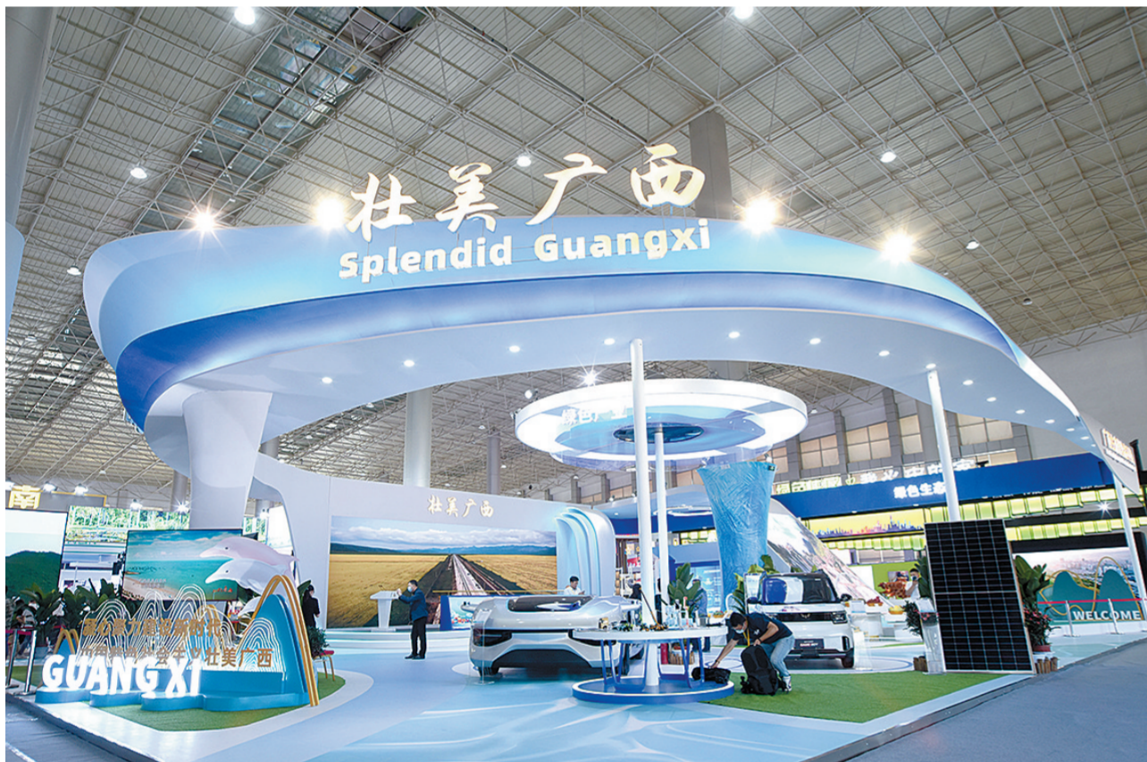
广西主宾省(区)展馆。