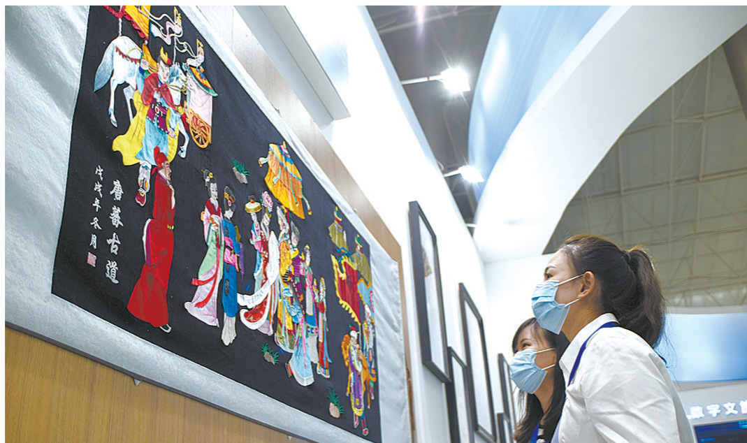
在第23届青洽会、第二届生态博览会展馆,青绣作品吸引省内外客商。

件,对于‘天津号’来说,是绝佳的测试地点。”杨海涛说,“作为集环保、智能等多元于一体的科技结晶,‘天津号’与青海省打造生态‘高地’、主攻产业‘四地’为主体的绿色低碳循环发展经济体系相得益彰,希望‘天津号’的青洽会、生态博览会之行,可以为青海高质量发展注入新动能,增添新活力。”