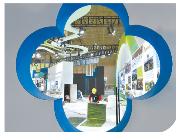
第23届中国·青海绿色发展投资贸易洽谈会、第二届中国（青海）国际生态博览会将于7月22日至24日在西宁市合并举办。7月20日，记者来到青海国际会展中心，工作人员正在井然有序地开展各项布展工作。