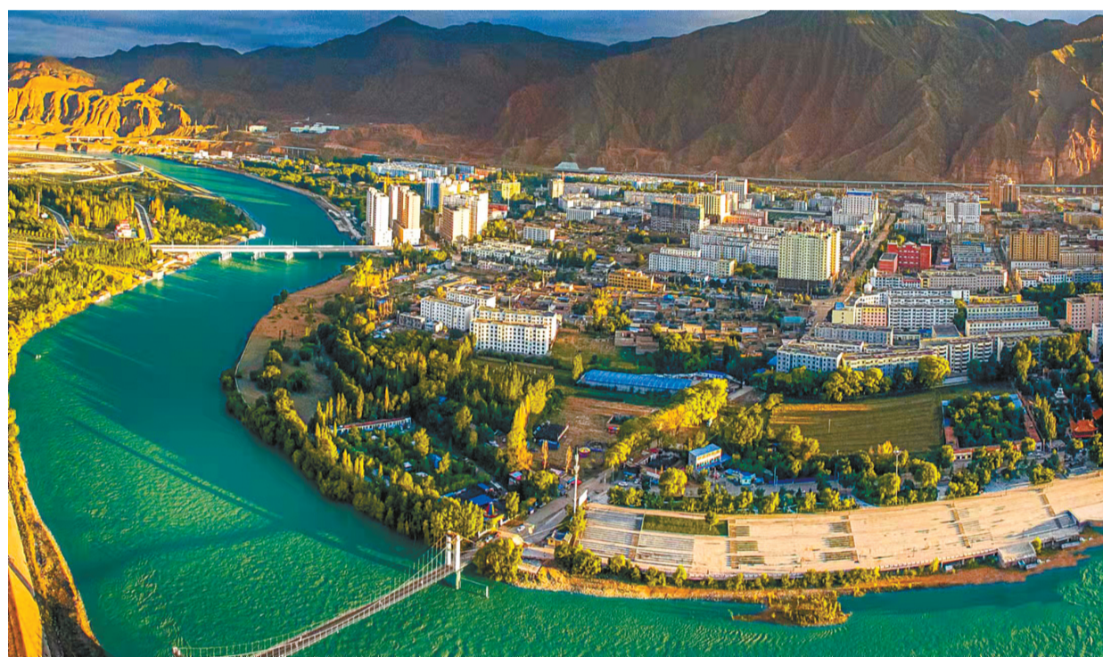
循化撒拉族自治县清水湾。