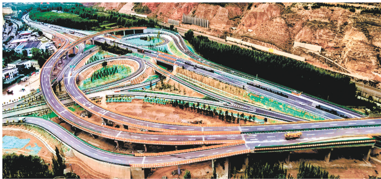
西互一级公路扩能改造工程建设任务全面完成。