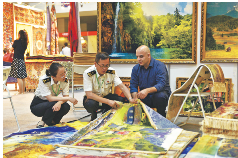
西宁海关关员在中国(青海)藏毯国际展览会上开展驻会监管工作。