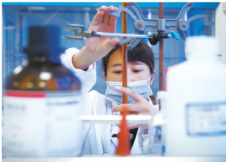
西宁海关技术中心工作人员测定枸杞中的二氧化碳含量。