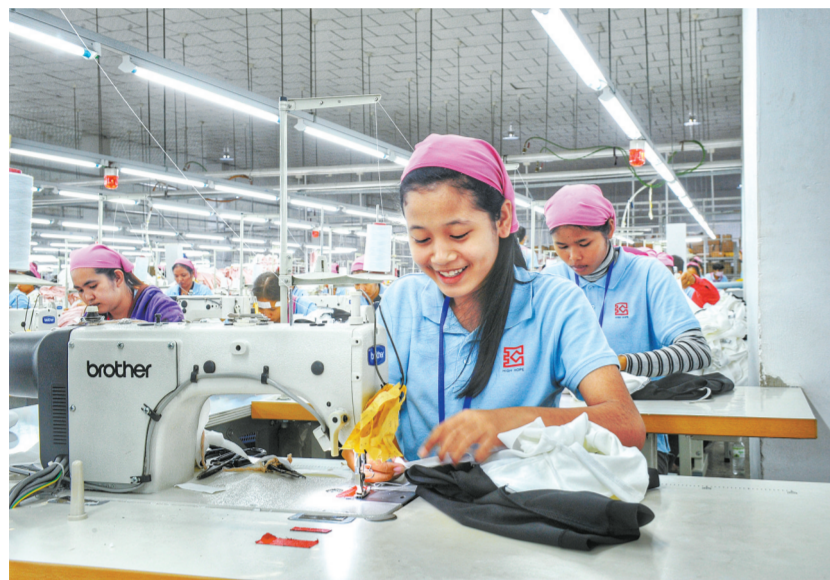
汇鸿集团在海外(柬埔寨)的企业,工人正在作业。

面对机遇，青海不断拓展多元化出口市场，帮扶打造高原特色品牌，努力把高原地区的“资源优势、生态优势、区位优势、政策优势”转化为“产业优势、品牌优势、出口优势和发展优势”。通过参与共建“一带一路”和推进区域协调发展，青海已从一颗梦想的种子成长为枝繁叶茂的大树，取得实打实、看得见、摸得着的成就。