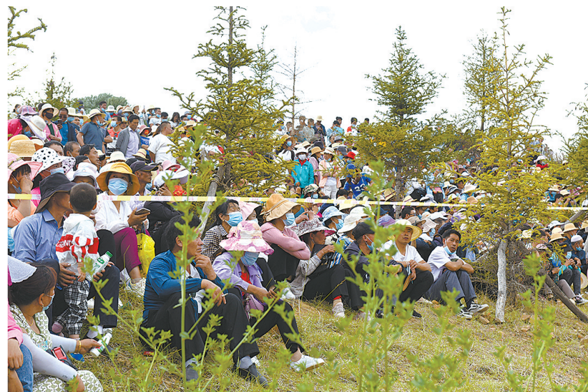
观众席地而坐聆听“花儿”。