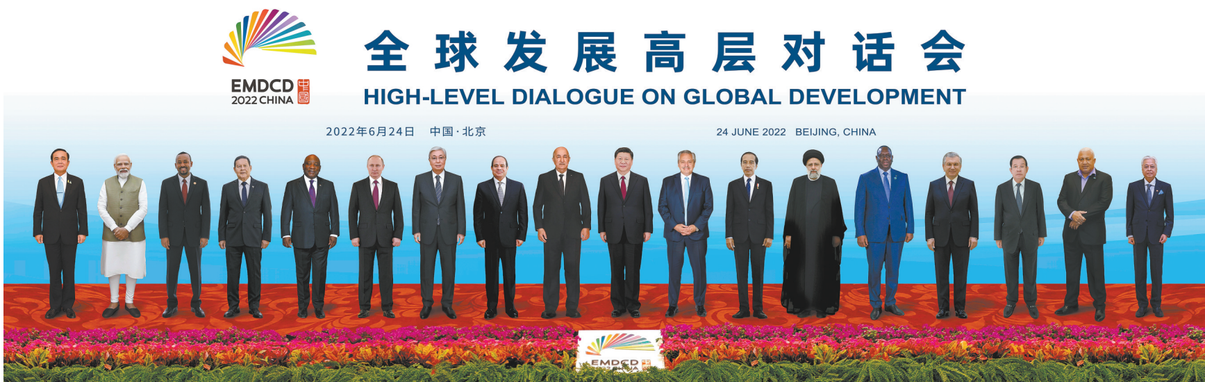
▲6月24日晚,国家主席习近平在北京以视频方式主持全球发展高层对话会并发表题为《构建高质量伙伴关系 共创全球发展新时代》的重要讲话。