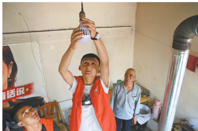
城东区清真巷街道凤凰园社区党员志愿者为居民更换电灯泡。