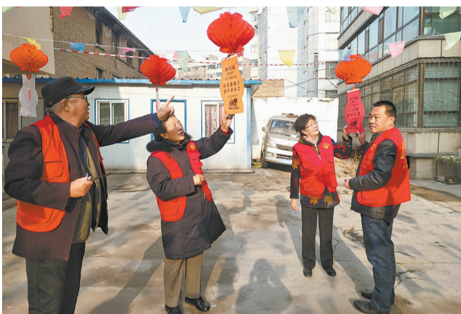
城西区礼让街街道长江路社区业主委员会开展日常巡逻。