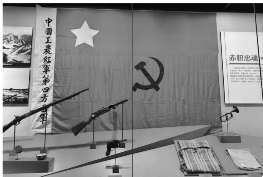
百年青海革命文物目录展上展出的军旗、军号、枪支等

省第十三次党代会以来,我省深入学习贯彻习近平总书记关于文物工作的重要论述和重要指示批示精神,坚持“保护为主,抢救第一,合理利用,加强管理”的文物工作方针,守正创新,继往开来,统筹疫情防控和文物事业发展,文物保护利用各项工作取得新成就、实现新突破。