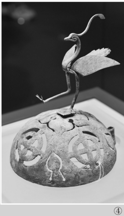
图① 喇家遗址考古发掘现场 图② 2021年绘彩陶主题社教活动 图③ 班玛县牛山岩画调查现场 图④ 青海历史文物展——大通上孙家寨汉晋墓出土鸾凤铜熏炉盖