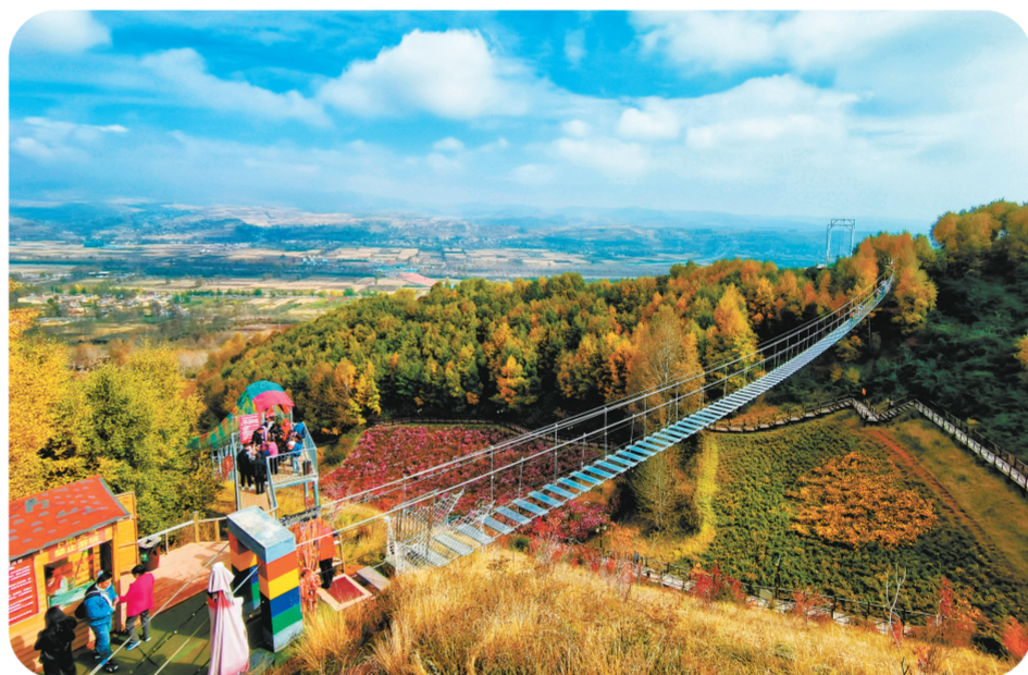
油嘴湾景区内内的栈道。互助油嘴湾景区负责人任臣义提供