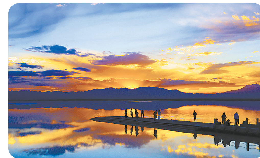
发挥生态优势,助推旅游高质量发展。