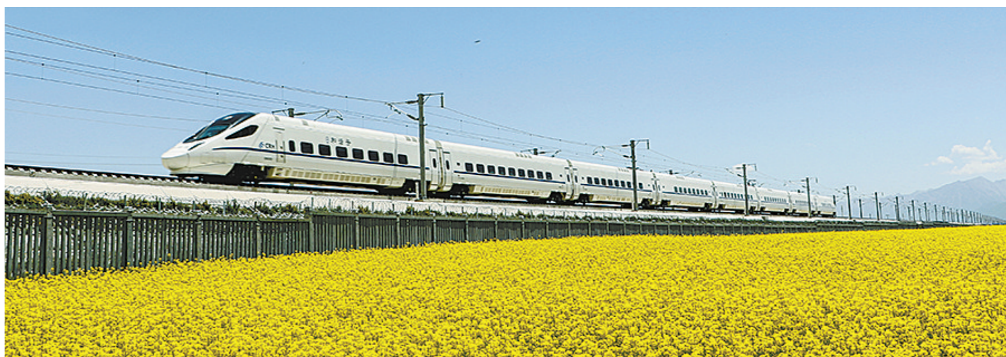
兰新高铁列车穿梭在“百里油菜花海”间,宛如游在画中,被人们誉为西北最美高铁线。