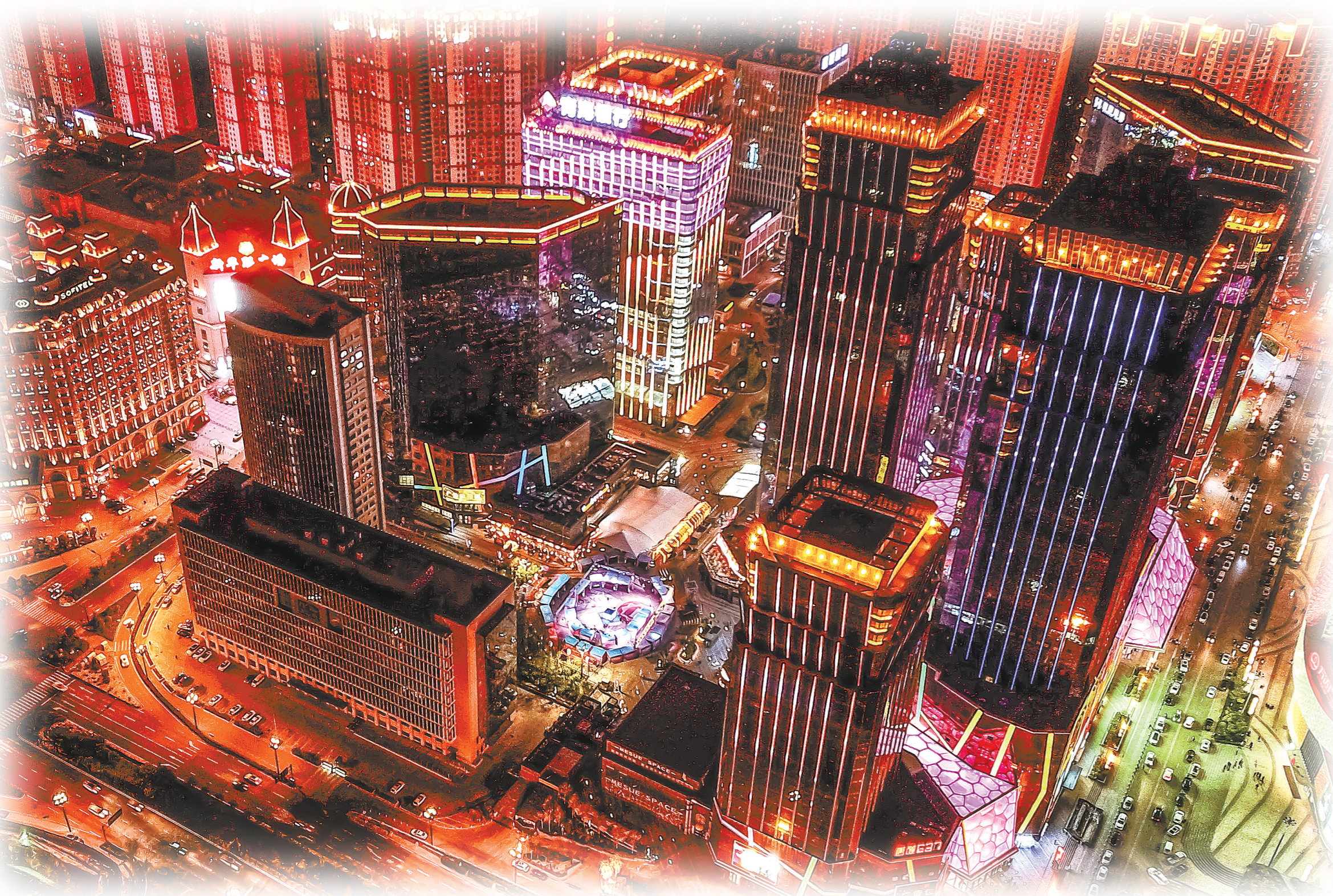
西宁的城市承载力、宜居性和包容性都在不断增强,城市面貌焕然一新。