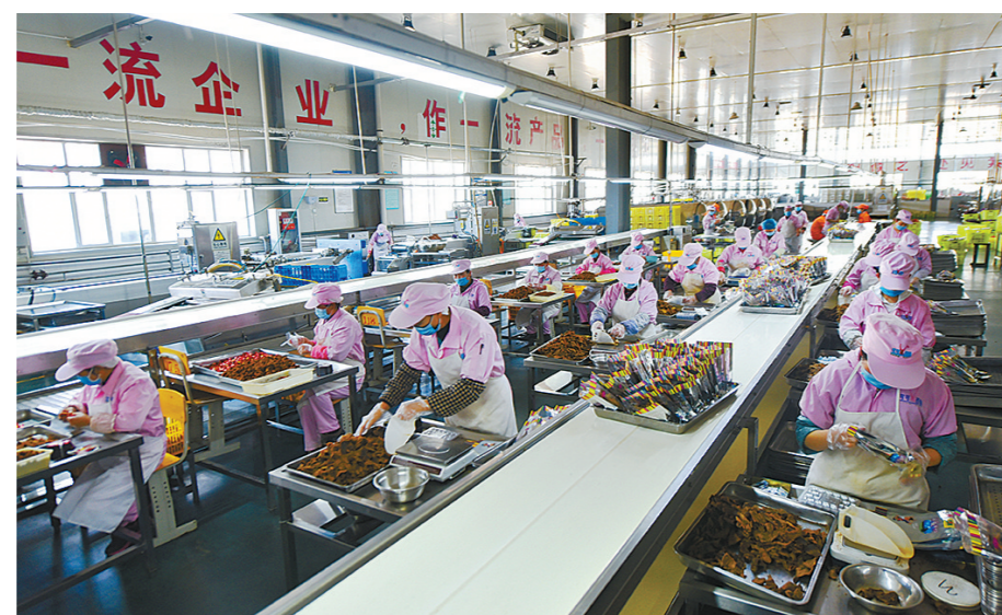
我省立足生态和资源优势,构建绿色产业体系,打造了一批“青字号”绿色品牌,在建设绿色有机农畜产品示范省的路上蹄疾步稳。