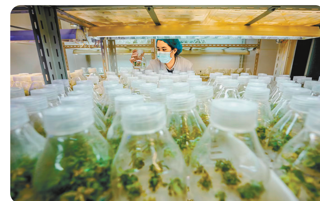
林业发展,科技不会缺席。城市绿化人以花草为伴,用汗水和坚守绘出这座城市诱人的绿意。