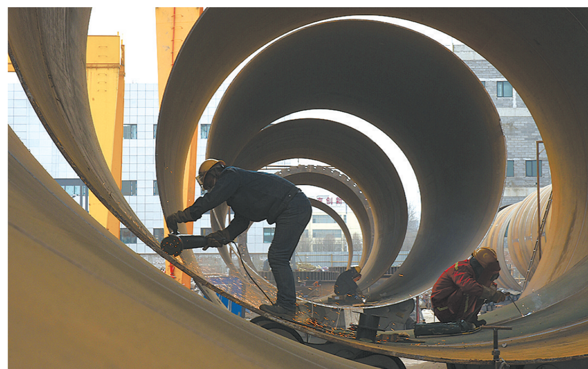
电子级多晶硅项目的顺利投产,对青海成为国家重要的清洁能源产业高地和电子材料基地具有强烈的推动作用。