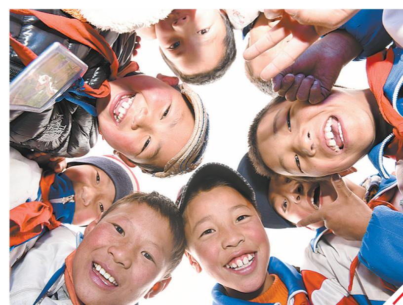
青海省不断加大教育投资,持续实施义务教育“全面改薄”工程、能力提升工程等,在校舍建设、师资补强等方面持续发力,进一步改善办学条件。