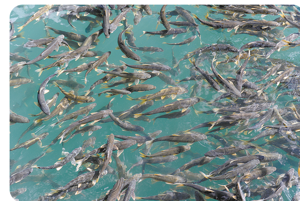
青海湖封湖育鱼科技力量的不断壮大、执法力度的逐渐加强、群众意识的持续提升、资源量的快速回升,彰显了我省深入实施重大生态工程的决心。