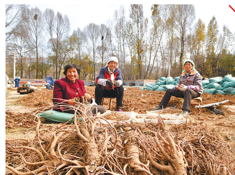
“苦药材”熬出“甜日子”,药材种植成为农民增收新渠道。