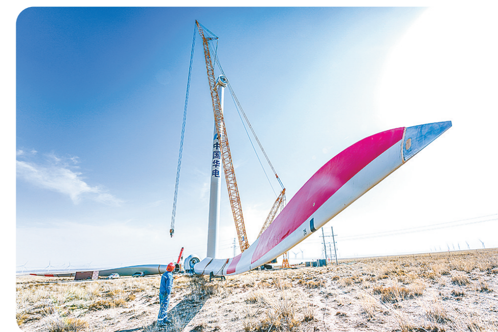
绿色能源助力地方经济发展。