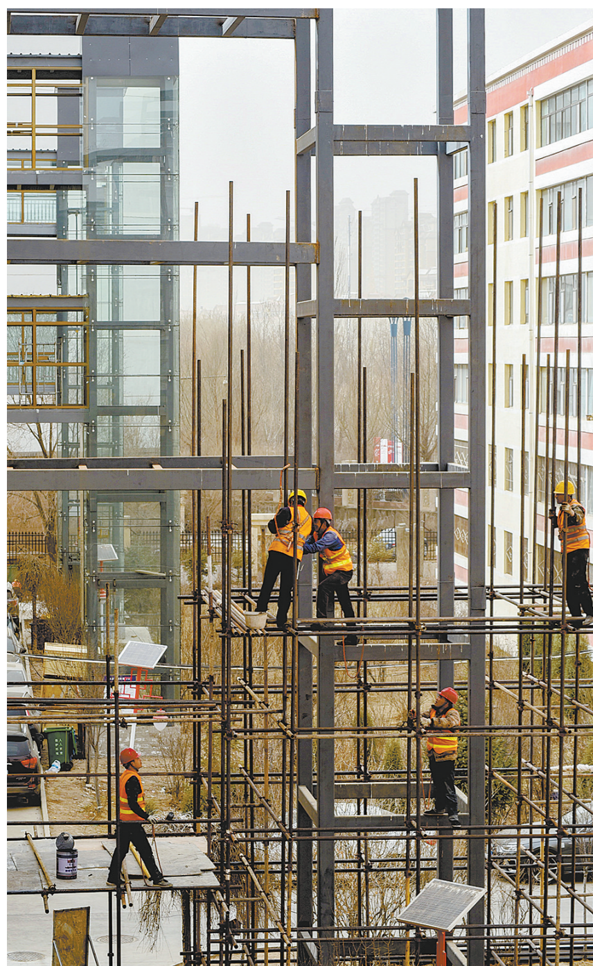
加装电梯工作,让老住宅功能更完善、居民生活更便利。