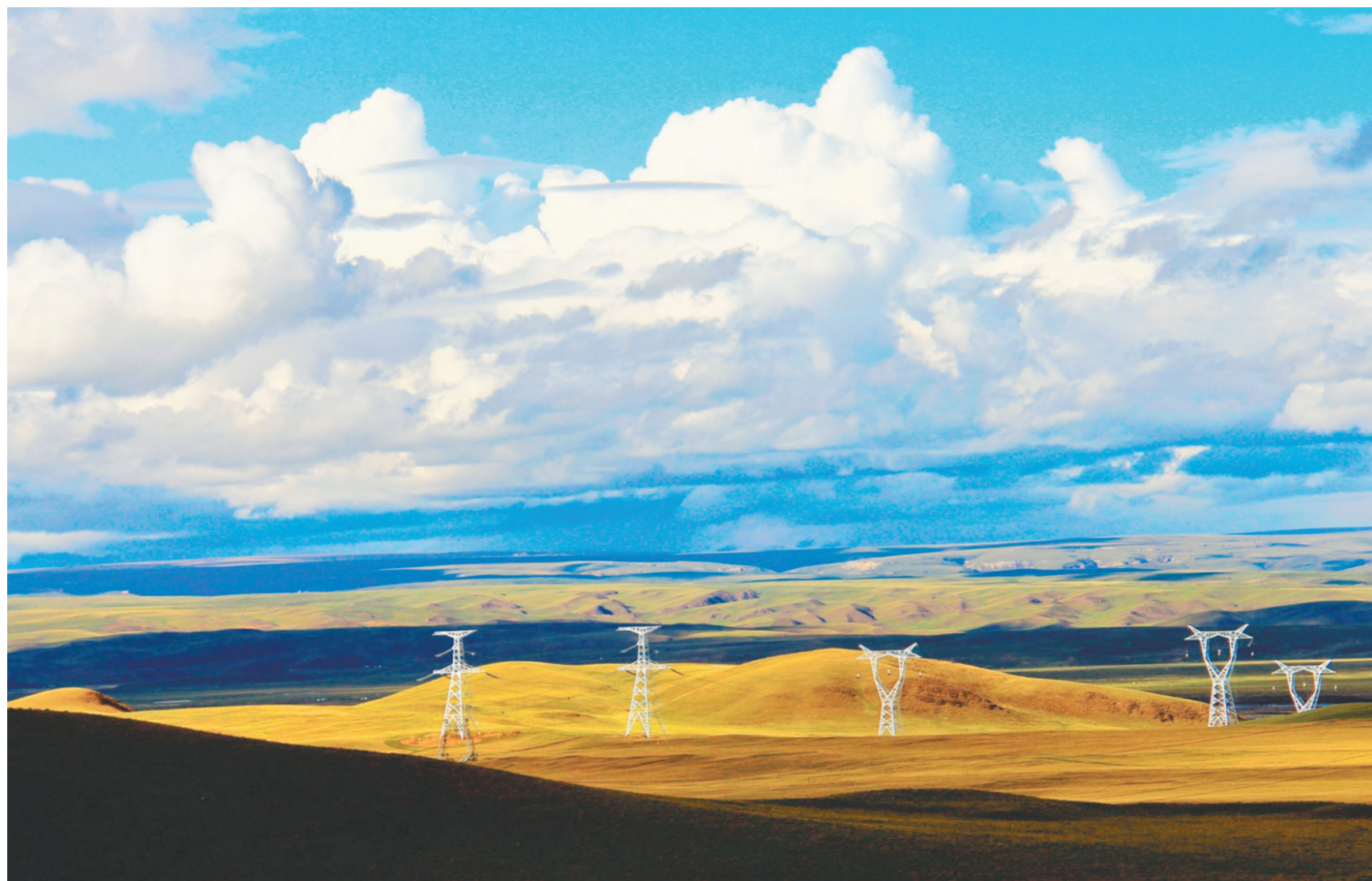
「金点子」撑起「生态电网」。