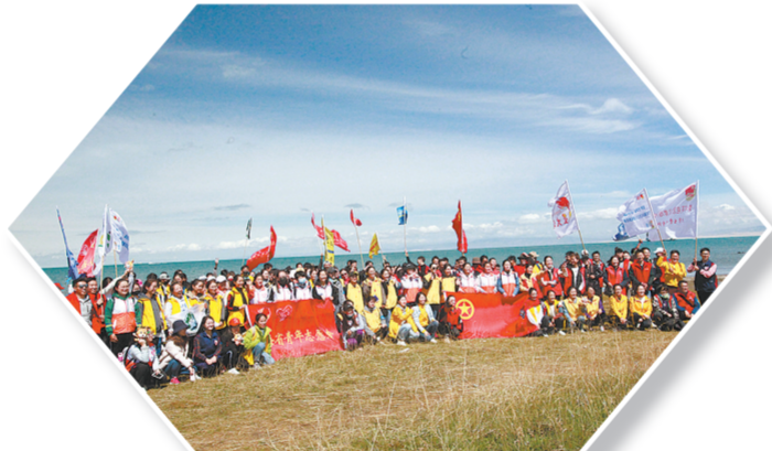
“保护青海湖 我是志愿者”青年志愿者联合行动。