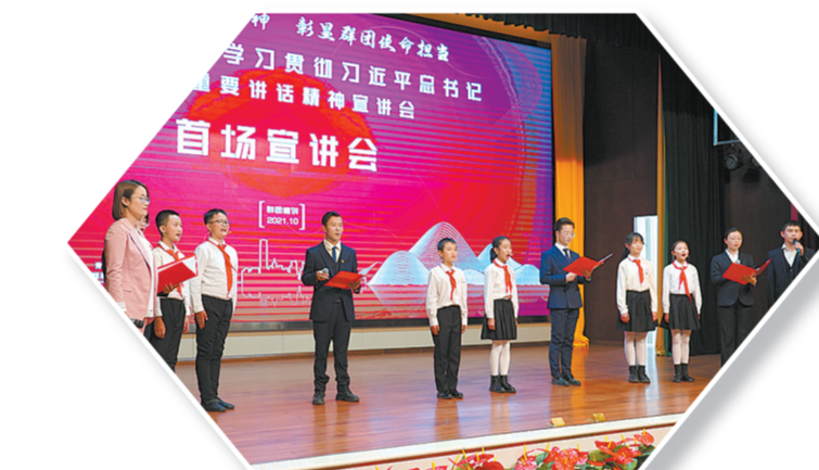
省级群团组织学习贯彻习近平总书记“七一”重要讲话精神宣讲会。

青年学生是最富活力、最具创造力的群体。自党史学习教育开展以来，全省共青团组织深入开展“学党史、强信念、跟党走”主题教育实践活动，教育引导广大青少年赓续红色血脉、担当时代责任。全省共有1.12万余个团支部开