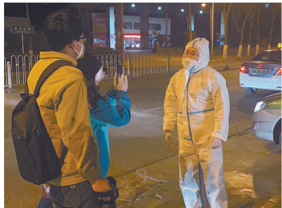
深夜探访,不放过任何一个抗疫故事。