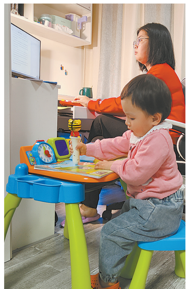
居家办公,及时、准确编发前方传来的每一条新闻线索。