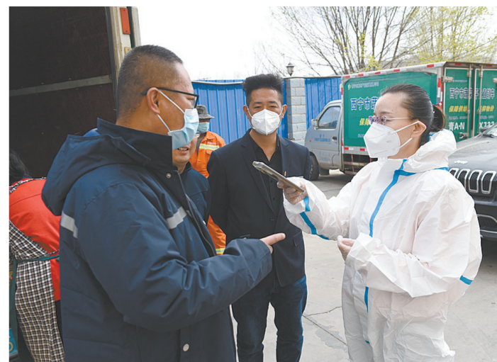
深入市场,了解市民“菜篮子”保障状况。