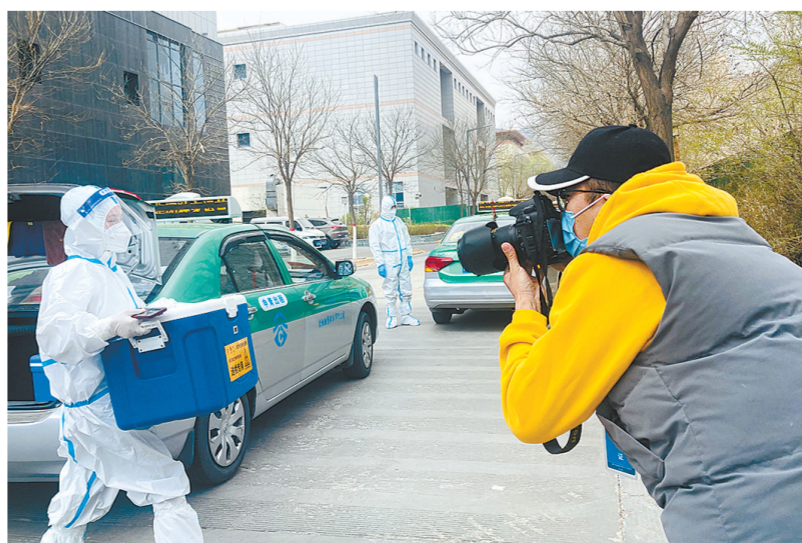
随机抓拍,不放过一线人员抗疫的任何精彩瞬间。