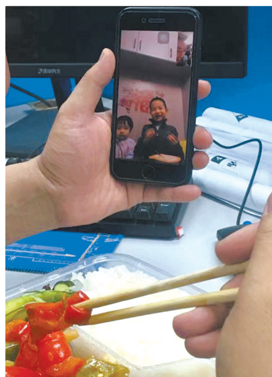
视频连线,与一双儿女互报平安。