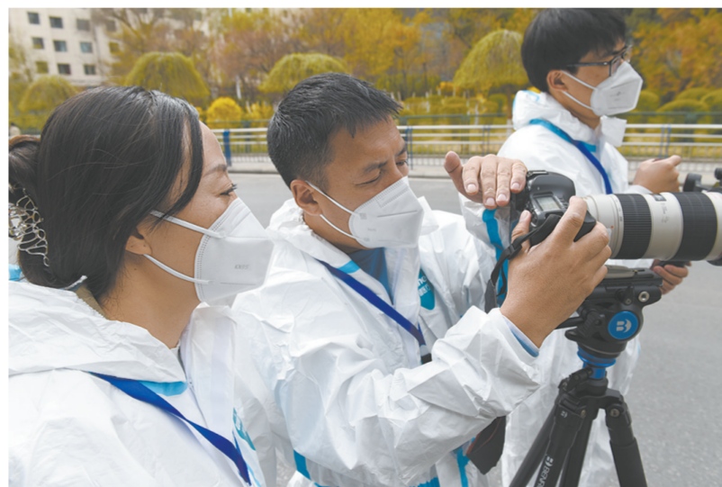
聚焦一线,将镜头对准最动人的抗疫画面。