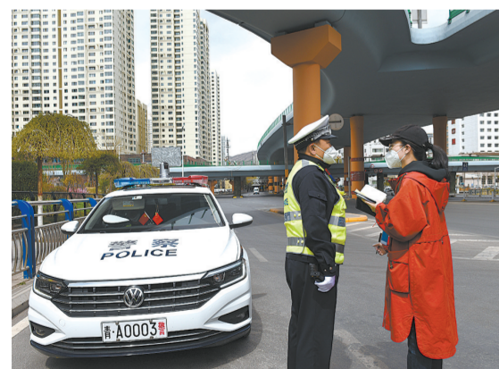
街头随访,实地采访日夜坚守一线的交通警同志。