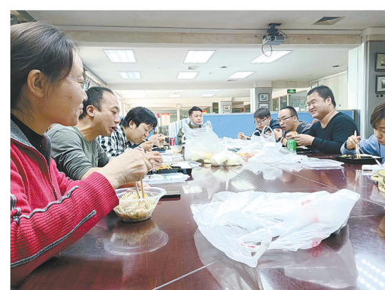
吃饭间隙,分享快乐相互解压。