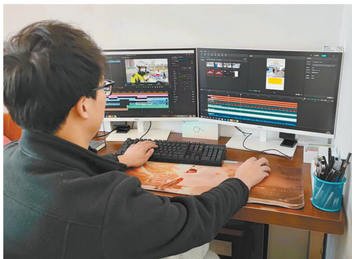
新媒力量,全方位准确、快速发布抗疫故事。

这个春天,疫情的阴霾笼罩着高原古城,青报人勇敢“逆行”,各路记者发挥所长,运用全媒体手段宣传疫情防控政策措施、报道群防群治生动实践、讲述抗疫先进典型故事。青报人凝聚起团结一心、抗击疫情的强大精神力量,为静态管理期间的受众送上定心丸、强心剂。