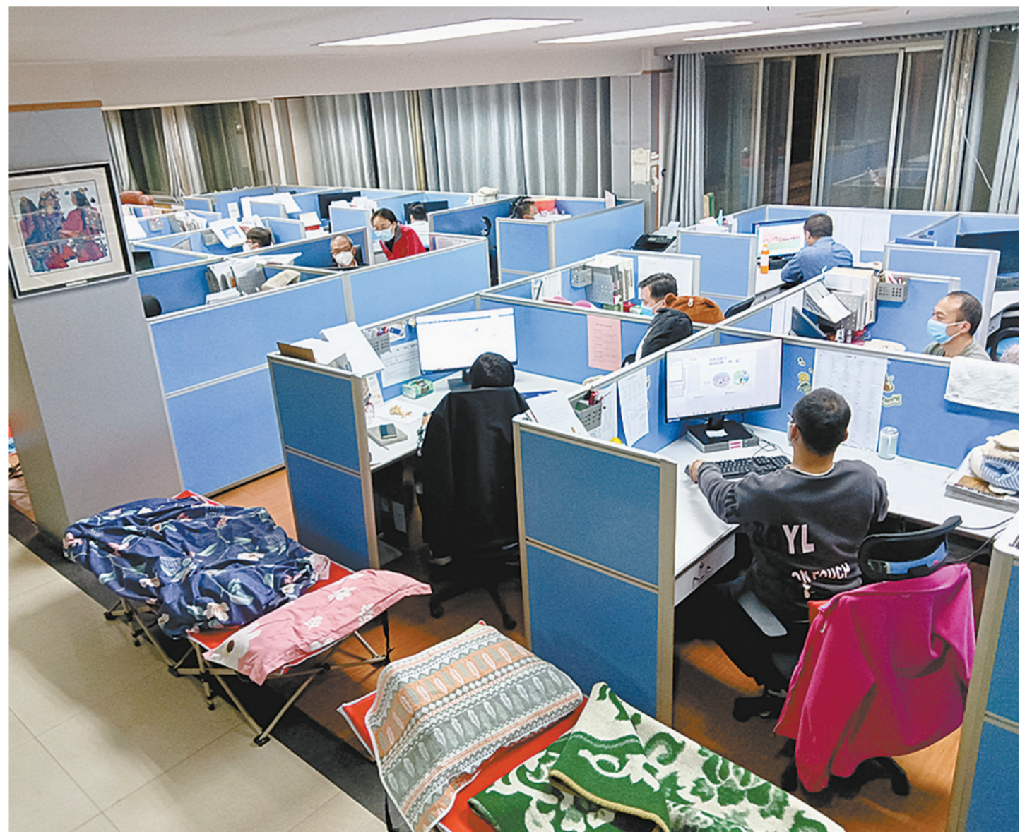
火速集结,编校人员齐心协力保障报纸出版质量。