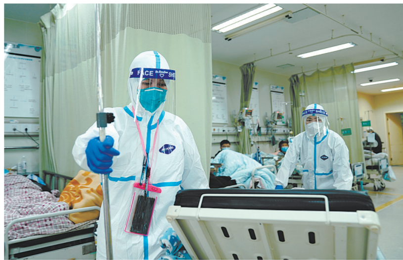
在复旦大学附属闵行医院急诊抢救室,医护人员在忙碌(4月20日摄)。