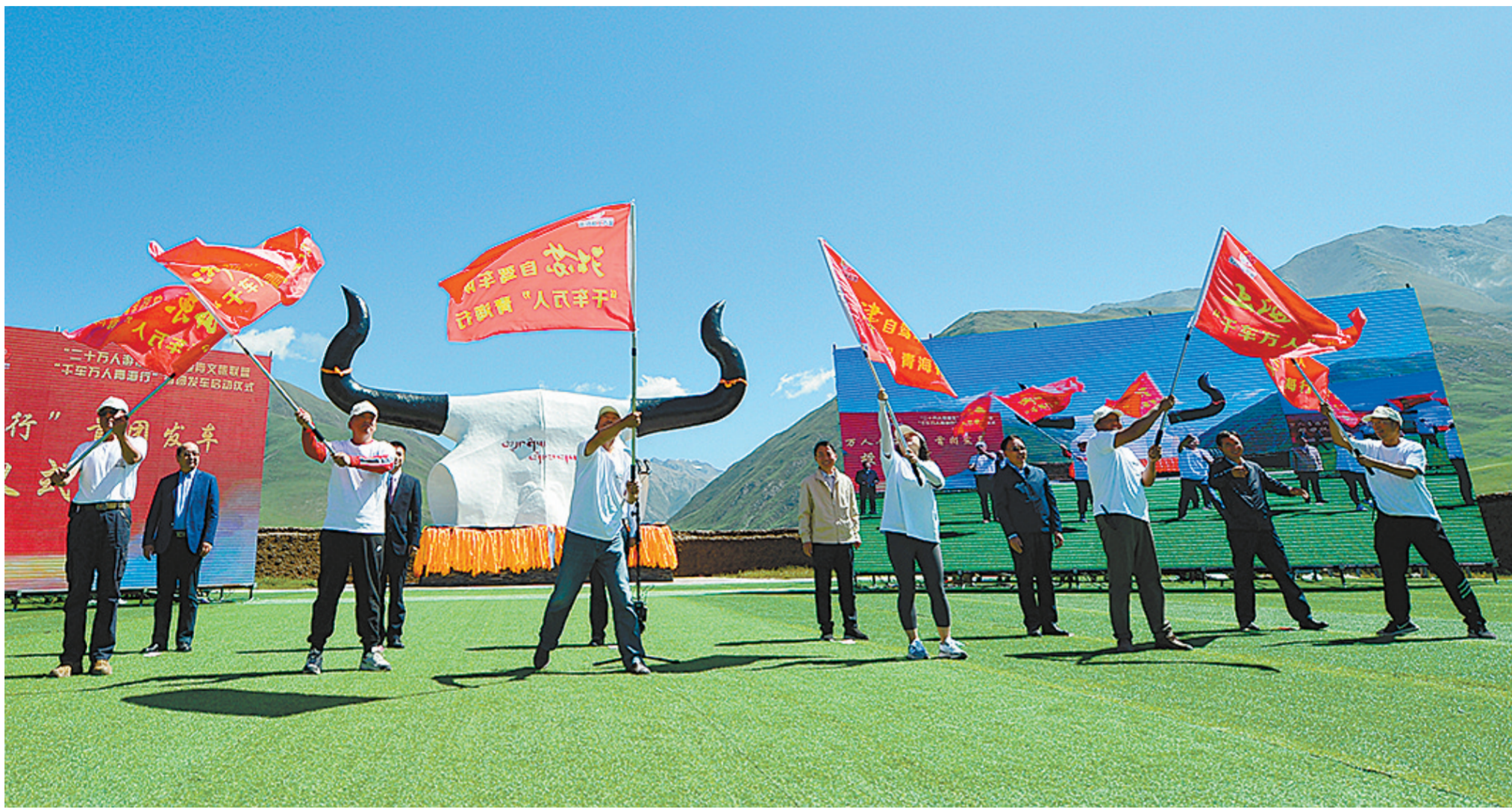
“二十万人游海北”暨援青文旅联盟“千车万人青海行”首发团启动仪式。