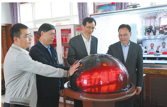
“智慧远程诊疗”项目上线运行。