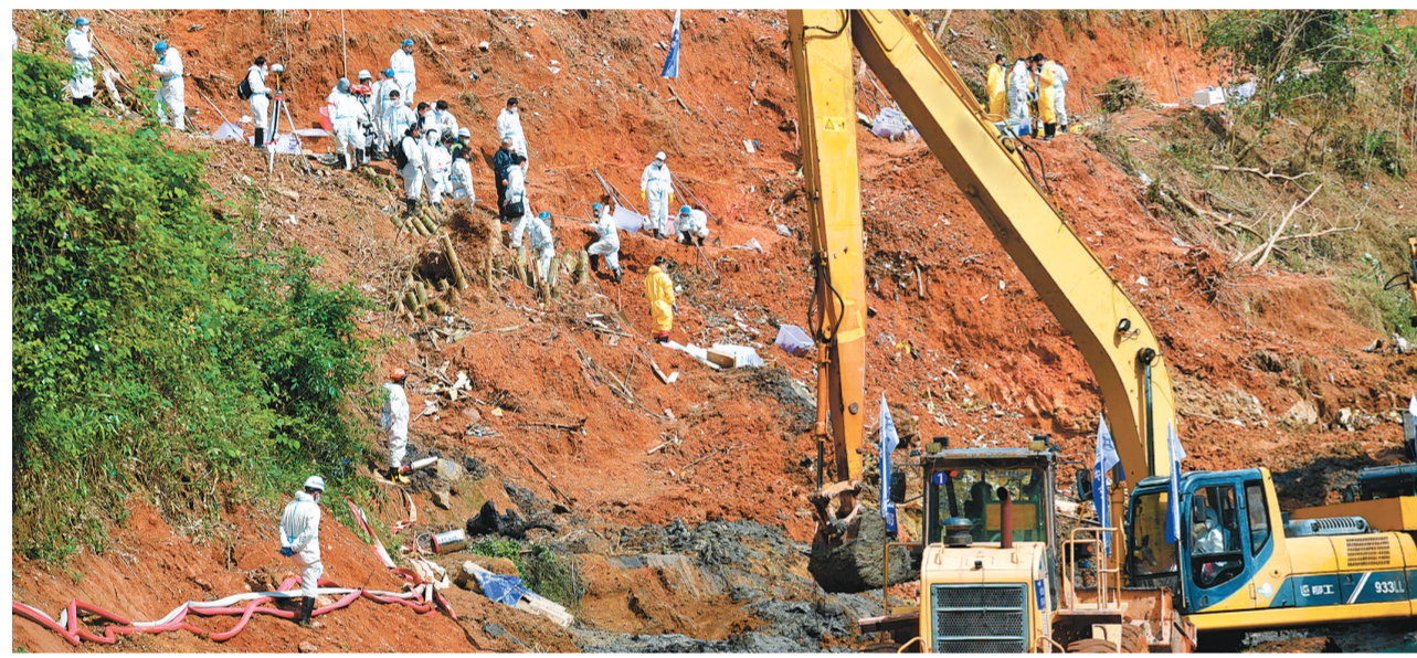
3月28日，搜寻人员在事故现场工作。当日，“3·21”东航MU5735航空器飞行事故救援进入第八天，搜寻工作仍在紧张进行中。