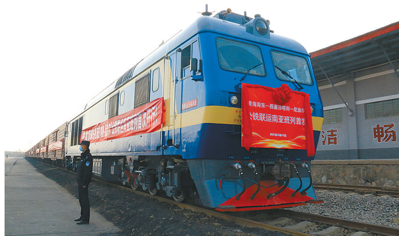
首列“青海海东-西藏日喀则-尼泊尔”公铁联运南亚班列开行。