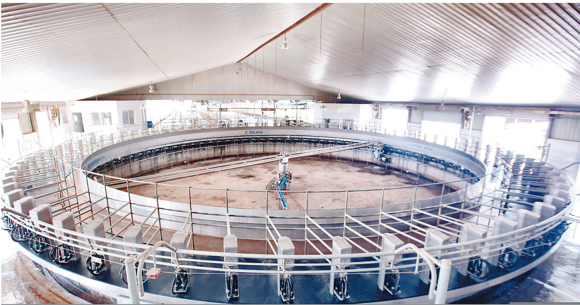
①西宁市湟中区西堡镇生态奶牛养殖建设项目(效果图)。