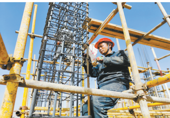
②西宁市湟中区西堡镇生态奶牛养殖项目施工现场。