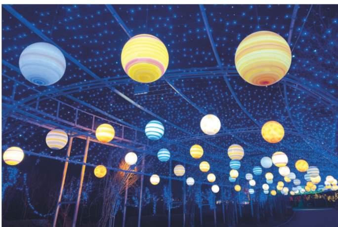
③西宁市大通回族土族自治县麻沟景区灯展。