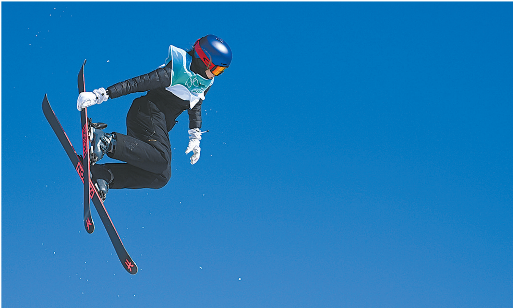
2月8日,中国选手谷爱凌在比赛中。 当日,在北京首钢滑雪大跳台举行的北京2022年冬奥会自由式滑雪女子大跳台决赛中,中国选手谷爱凌夺得冠军。