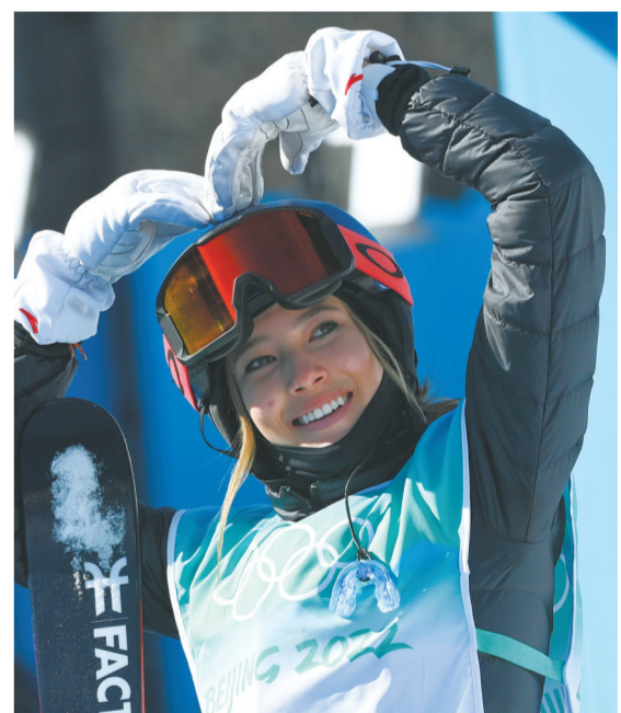
2月7日,中国选手谷爱凌在比赛后。当日,北京2022年冬奥会自由式滑雪女子大跳台资格赛在北京首钢滑雪大跳台举行。