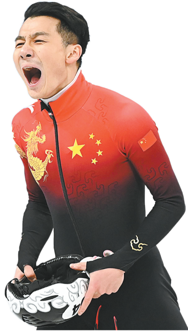
2月7日,任子威在比赛后庆祝。当日,在首都体育馆举行的北京2022年冬奥会短道速滑项目男子1000米决赛中,中国选手任子威夺得冠军。

成为爱尔兰史上首位雪橇运动员,以一己之力创建爱尔兰雪橇协会……直到今天,她终于站在了冬奥会的赛场上。虽然排名靠后,