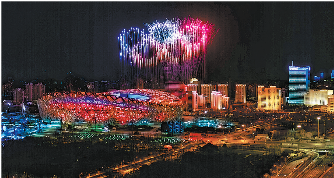
二月四日晚,第二十四届冬季奥林匹克运动会开幕式在北京国家体育场举行。这是焰火表演。