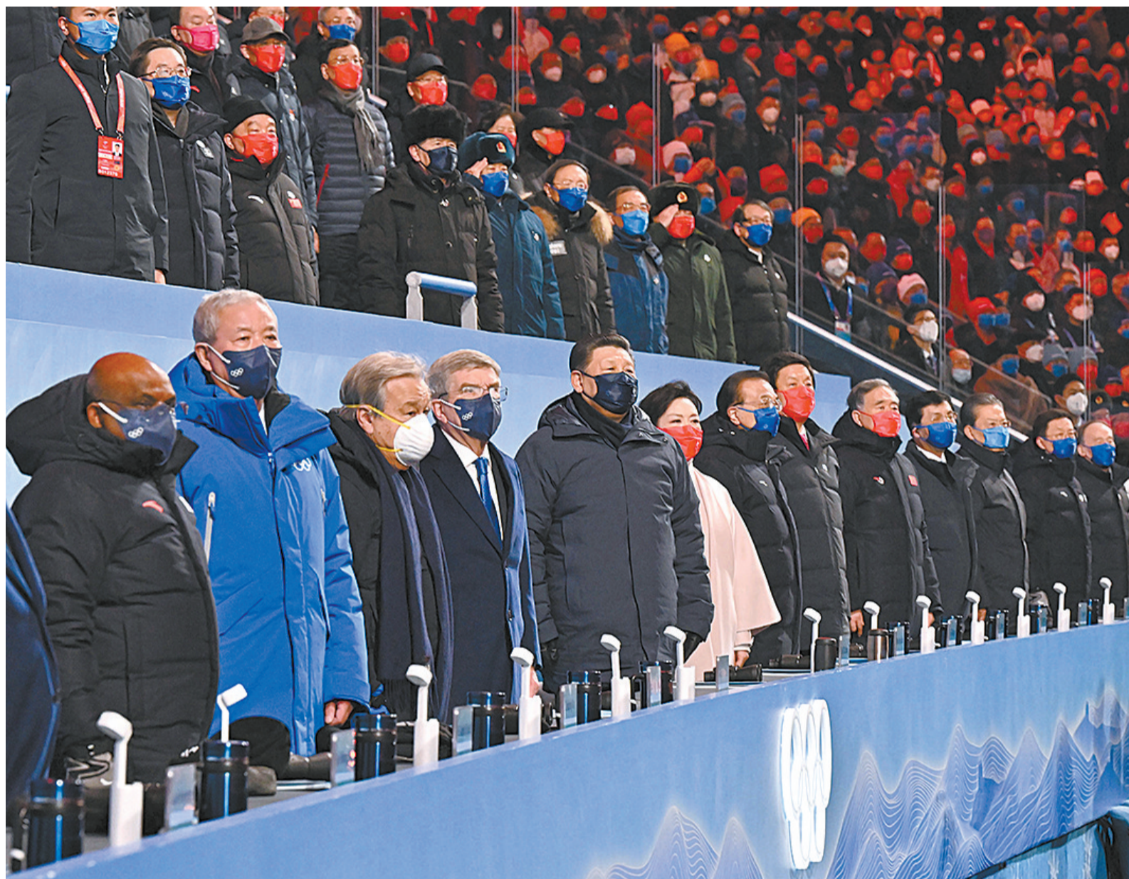
2月4日晚,北京第二十四届冬季奥林匹克运动会开幕式在国家体育场隆重举行。习近平、李克强、栗战书、汪洋、王沪宁、赵乐际、韩正、王岐山等党和国家领导人出席开幕式。

新华社北京2月4日电 筑梦冰雪,同向未来。2022年2月4日晚,举世瞩目的北京第二十四届冬季奥林匹克运动会开幕式在国家体育场隆重举行。国家主席习近平出席开幕式并宣布本届冬奥会开幕。中华文明与奥林匹克运动再度携手,奏响全人类团结、和平、友谊的华美乐章。