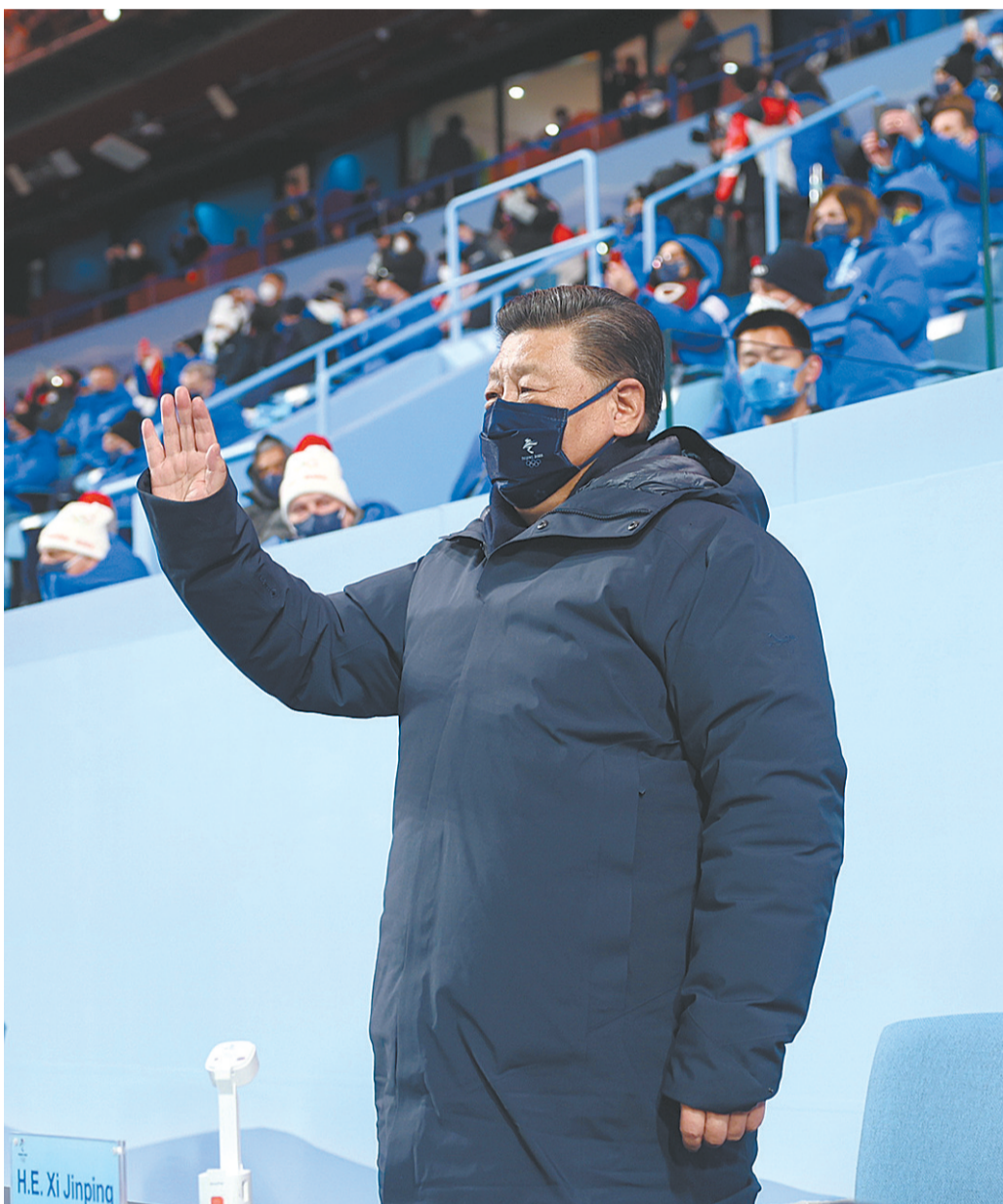
2月4日晚,北京第二十四届冬季奥林匹克运动会开幕式在国家体育场隆重举行。这是国家主席习近平在主席台上向大家挥手致意。新华社记者 鞠鹏 摄

李克强栗战书汪洋王沪宁赵乐际韩正王岐山 国际奥委会主席巴赫 来自世界各地的领导人和贵宾等出席