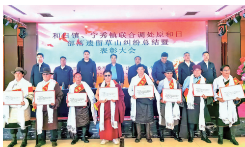
和日镇、宁秀镇联合调处原和日部落遗留草山纠纷总结暨表彰大会现场。