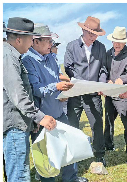
同仁市瓜什则乡力吉村与保安镇全都村化解地界草山纠纷。