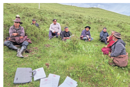
河南蒙古族自治县人民法院法官、人民陪审员到宁木特镇周龙村巡回调解一起侵权责任纠纷案。