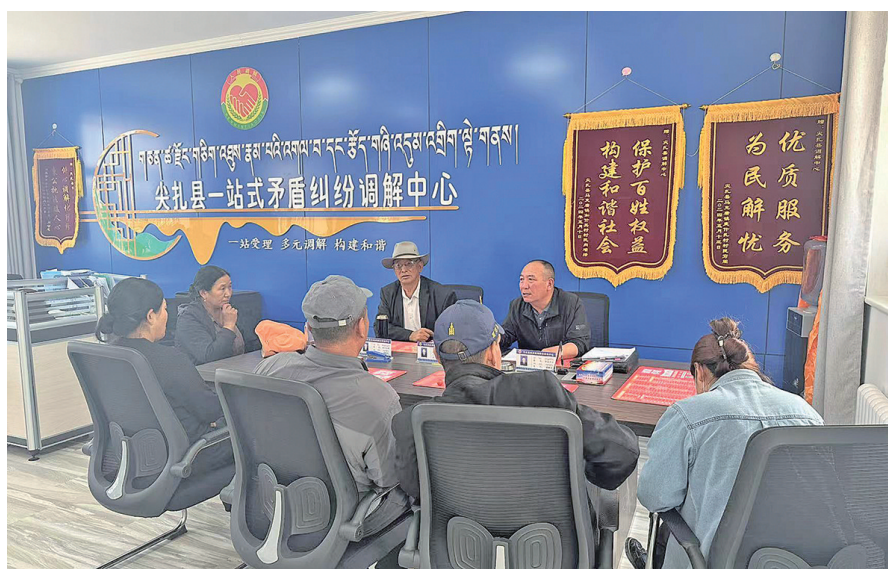
尖扎县矛调中心调解婚姻纠纷现场