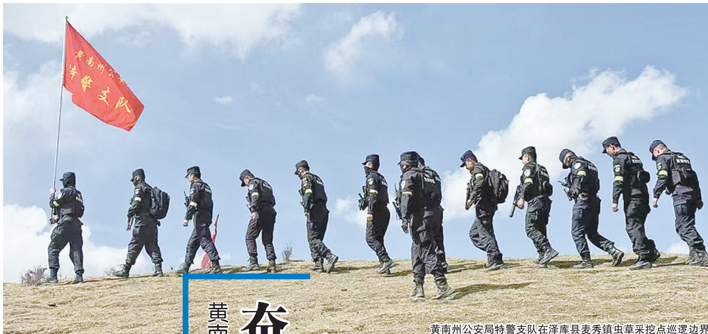
黄南州公安局特警支队在泽库县麦秀镇虫草采点巡逻边界