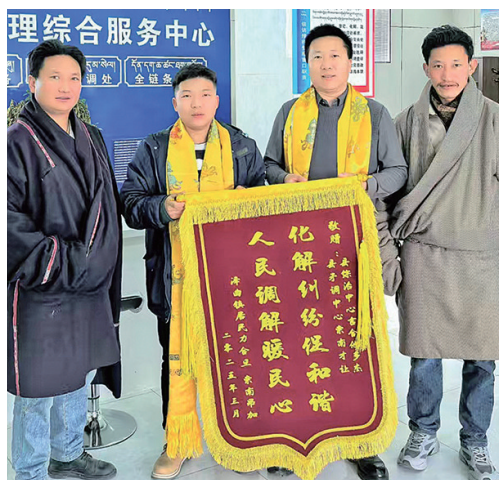
泽库县社会治安综合治理中心成功调处一起车辆买卖合同纠纷案。