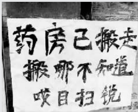
最后一句英文太牛了