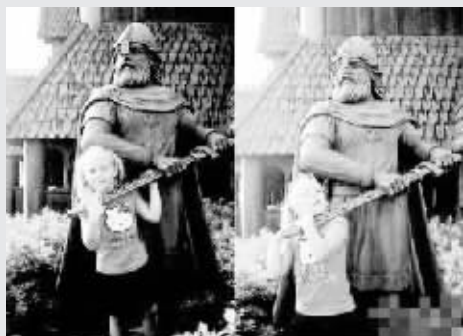
熊孩子是这样照相的