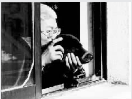
我不是单反,你个二货主人