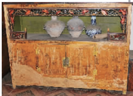
书架炕柜:旧时河湟女儿的陪嫁物