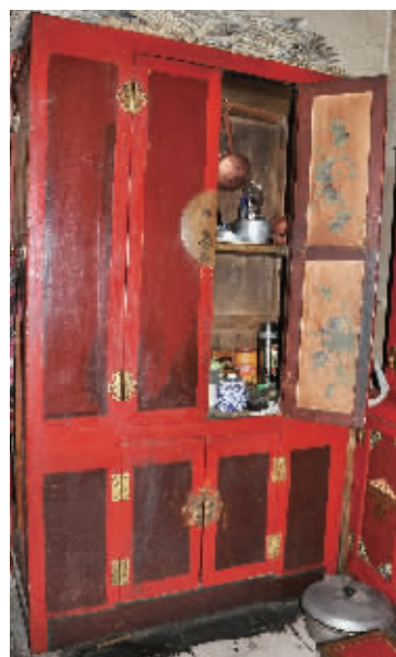
青海书画大家莫如志用过的立柜