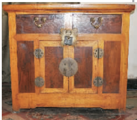
钱柜:老河湟人家的“保险柜”