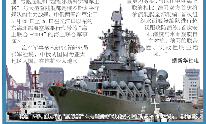
18日下午,俄罗斯“瓦良格”号导弹巡洋舰抵达上海吴淞军港码头。