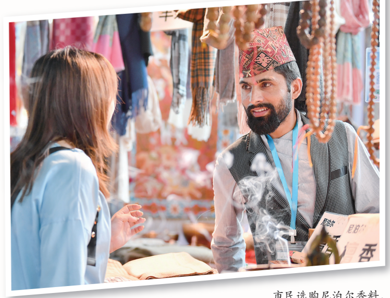
市民选购尼泊尔香料。