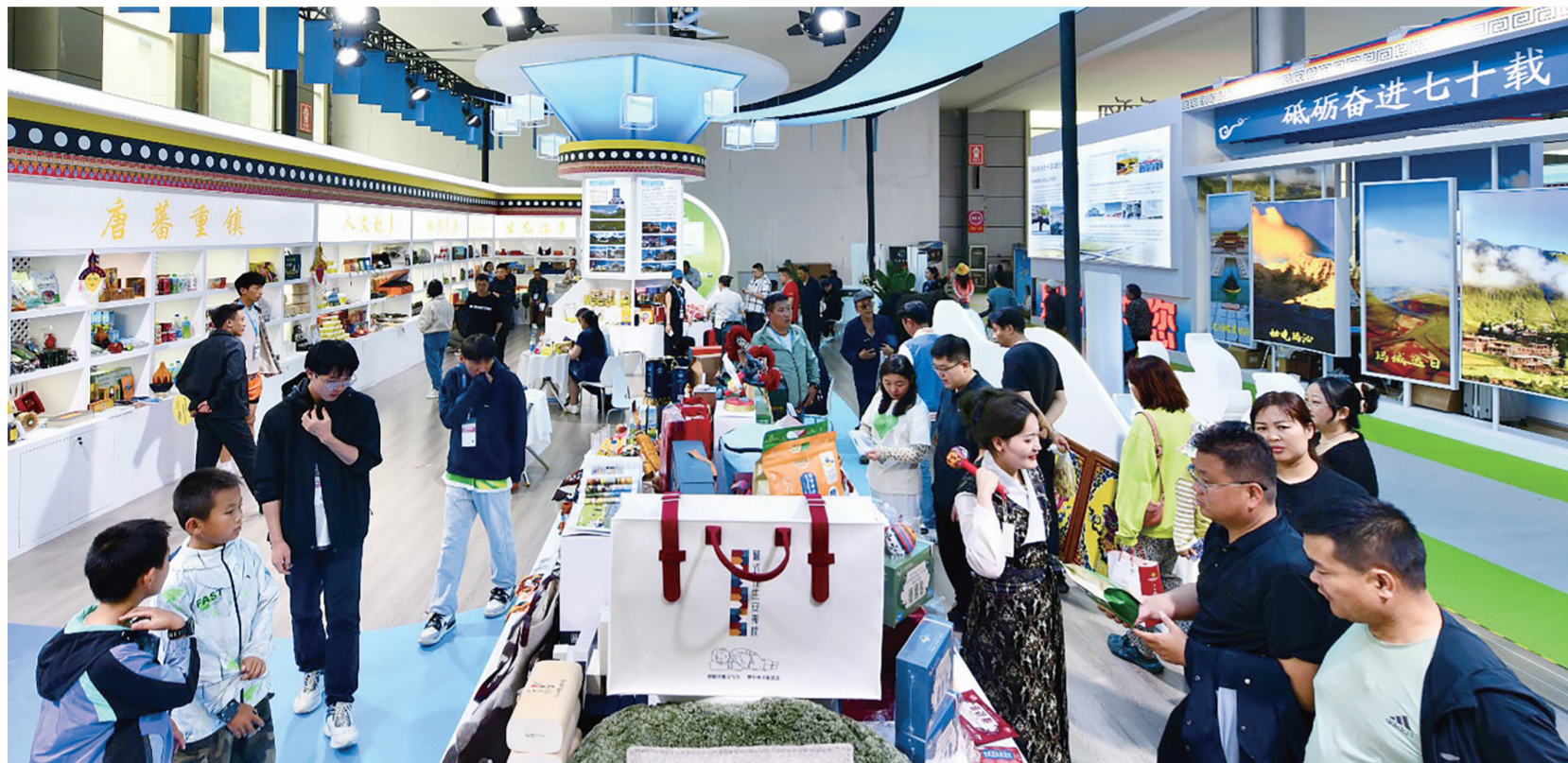
玉树藏族自治州展馆人气旺。