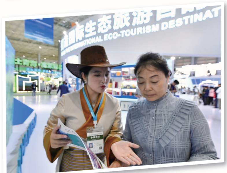
为市民介绍相关青海旅游线路。