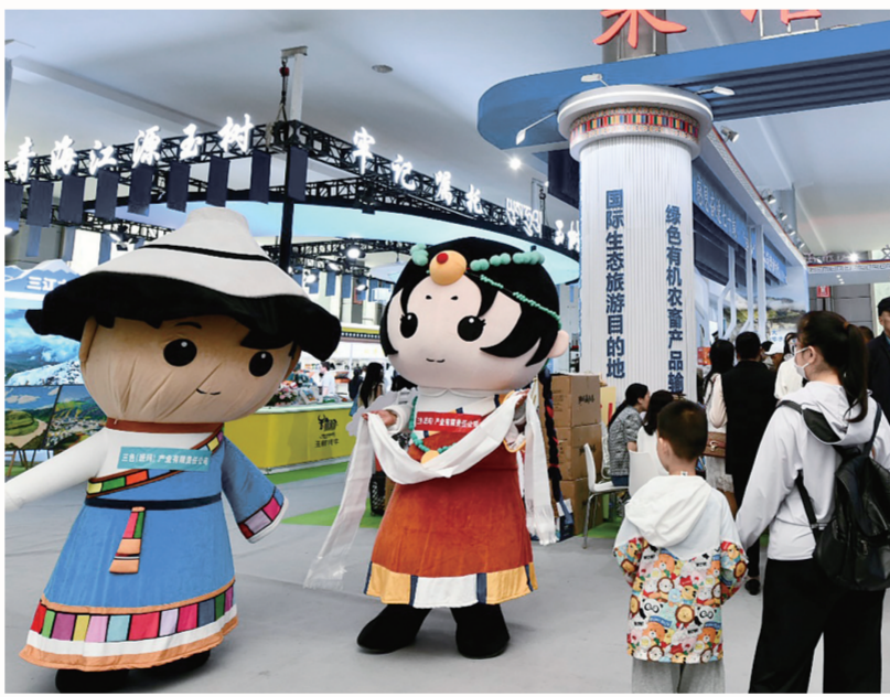
果洛藏族自治州展馆人气爆棚。