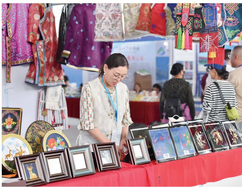
琳琅满目的青海特色服饰和工艺品。