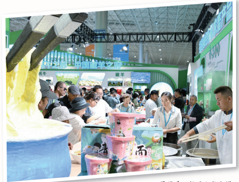
展区手工拉面人气火爆。