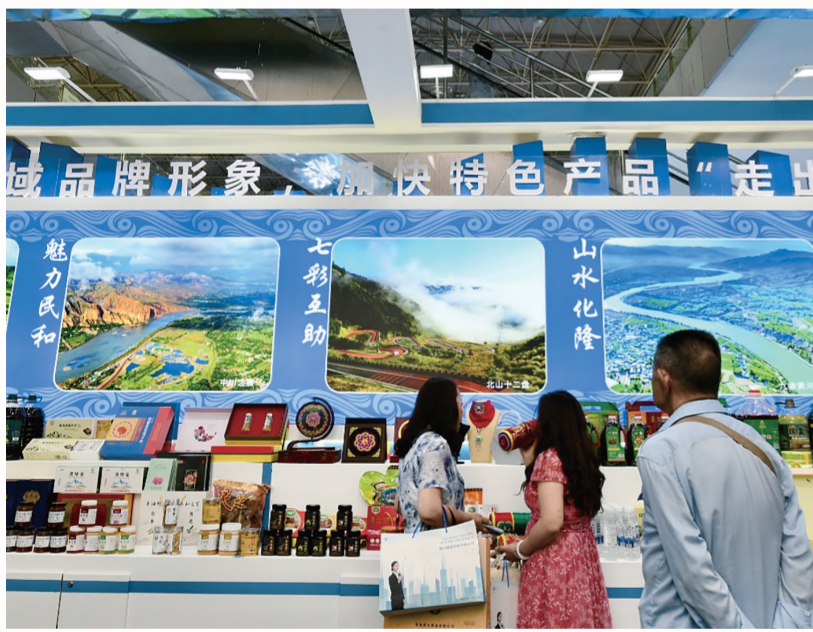
海东市展馆特产展区一角。