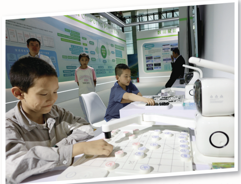
少年儿童与机器人“对弈”。