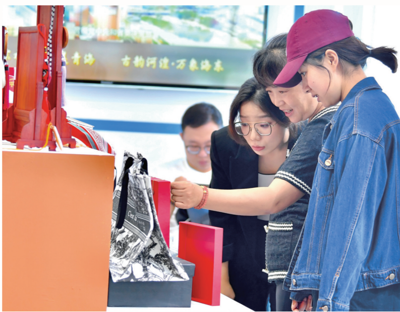
市民了解海东市文创艺术品。