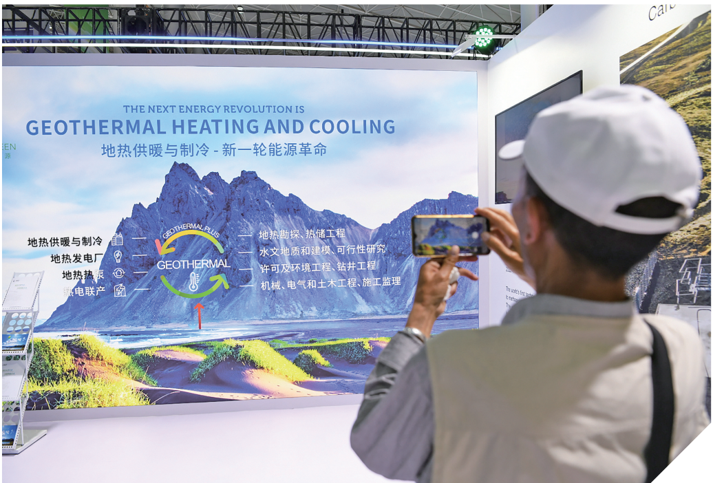
观众参观冰岛馆。

“你瞧,这几天关于青洽会上发生的事儿我们都了解到,刚才我们搜索小程序知道展区足有5万平方米,我们想先通过云展厅了解一下各个展馆的信息,如果不提前了解一下的话,就怕错过有特色、有意思的展馆。”张福说。