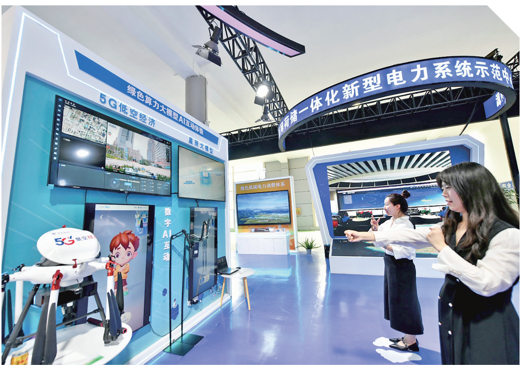
观众参观冰岛馆。