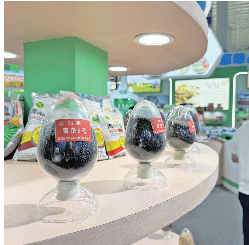
现场展示的藜麦种业科技创新成果。

展区里,既有“接地气”的业态售卖、交流洽谈,又有“高大上”的数字农业应用场景展示。一块现场搭建的24平方米LED拼接屏上,“青海农机驾驶舱”几个字跃然于屏幕最上方,下方各板块以农机数据实时自动监测、数据统计、数据分析以及大数据应用的形式展示了全省农机分布、农机作业进度、农区作业情况、“哪哪农机”供需服务、农机补贴、农机应急调度等数字化一张图,让人眼前一亮。