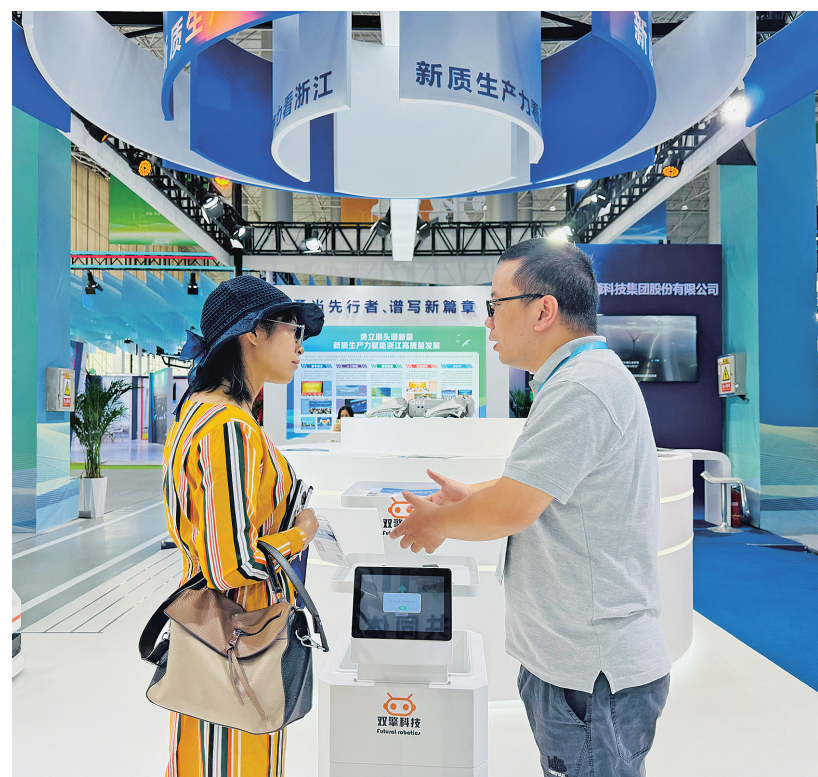
本届青洽会最吸睛的当属人工智能机器人。

“现在,青洽会更开放、更国际化、更专业、更有特色,今年还邀请了冰岛作为主宾国,首次设置主宾国展区,青洽会,越来越国际范儿!”作为青洽会的老朋友,白凯瑞感慨着青洽会的变化,除此之外,青洽会科技感十足,这也是我每年坚持带孩子来逛展的期待