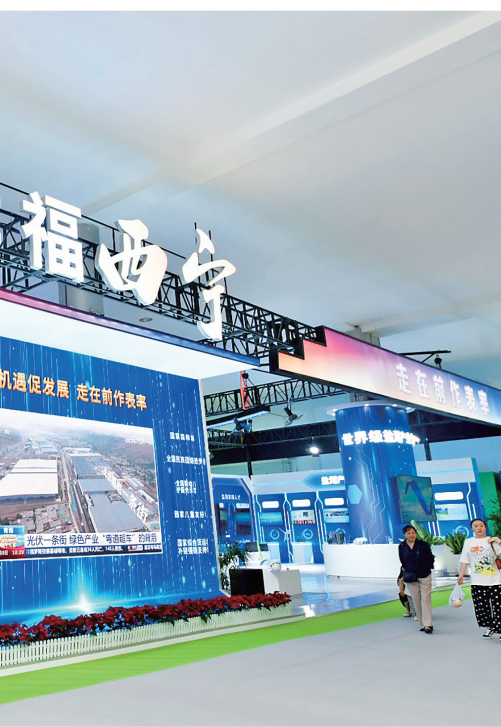
市民体验数字人AI技术。

通过高频次、高精度三维模型应用,在盐湖智慧工地可实现无人机(盐湖星盾)安全巡检,有效提升进行规范化、安全化。平台系统规划作业任务,真正高效远程作业。