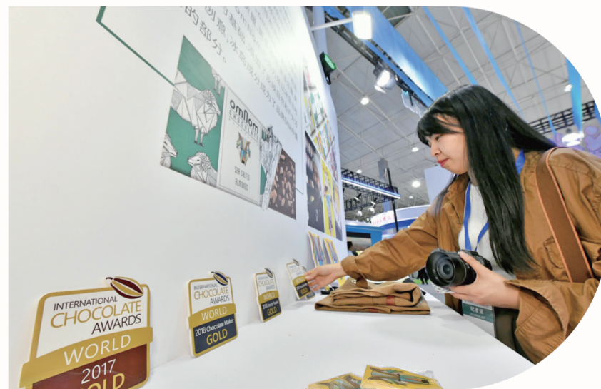
市民选购冰岛巧克力。