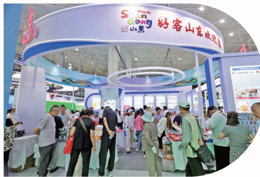
山东展区美食吸引民众前来品尝。