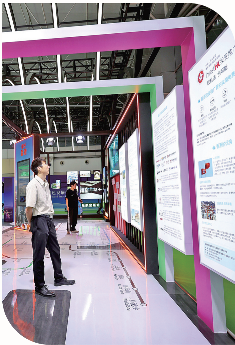
市民驻足了解香港文化。