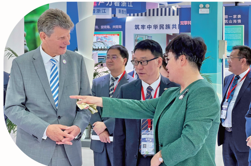
与外籍嘉宾交流讨论。