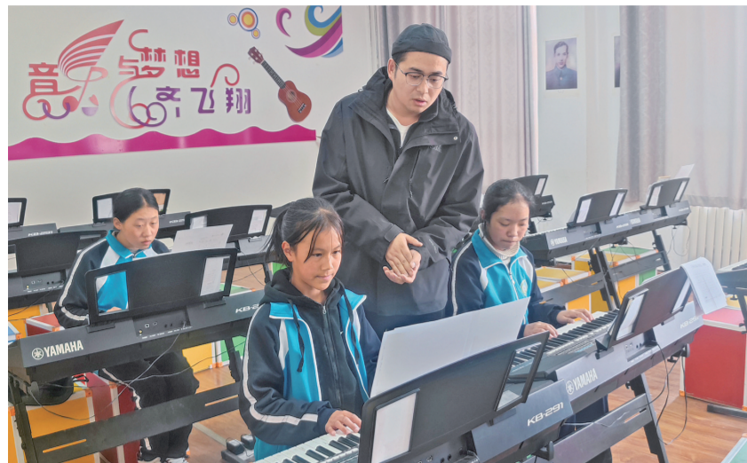
上海助力果洛教育高质量发展。