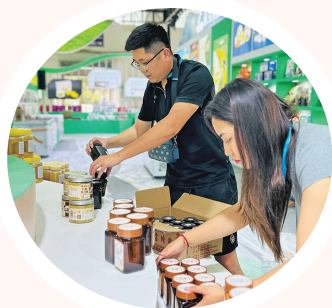
参展商正在摆放展品。