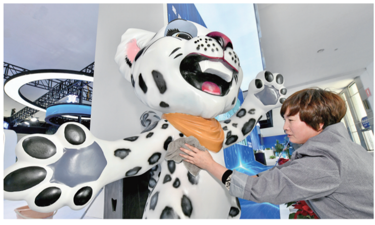
保洁人员擦拭雪豹吉祥物。