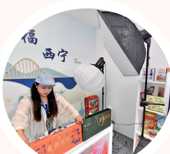
工作人员准备直播展台。