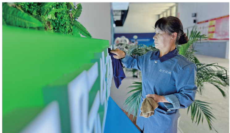
保洁人员清洁展厅。