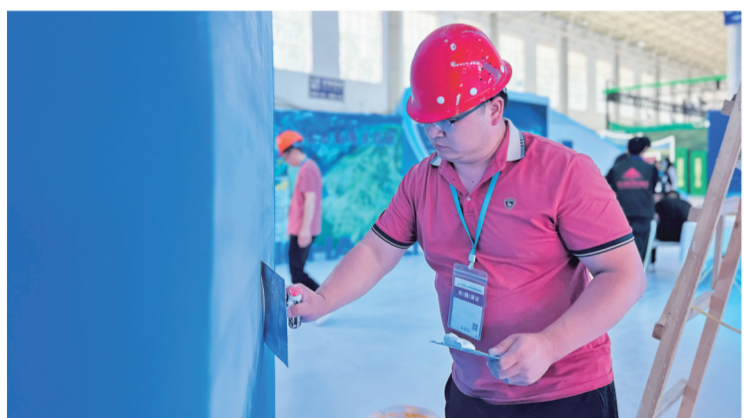
工作人员装饰墙面。