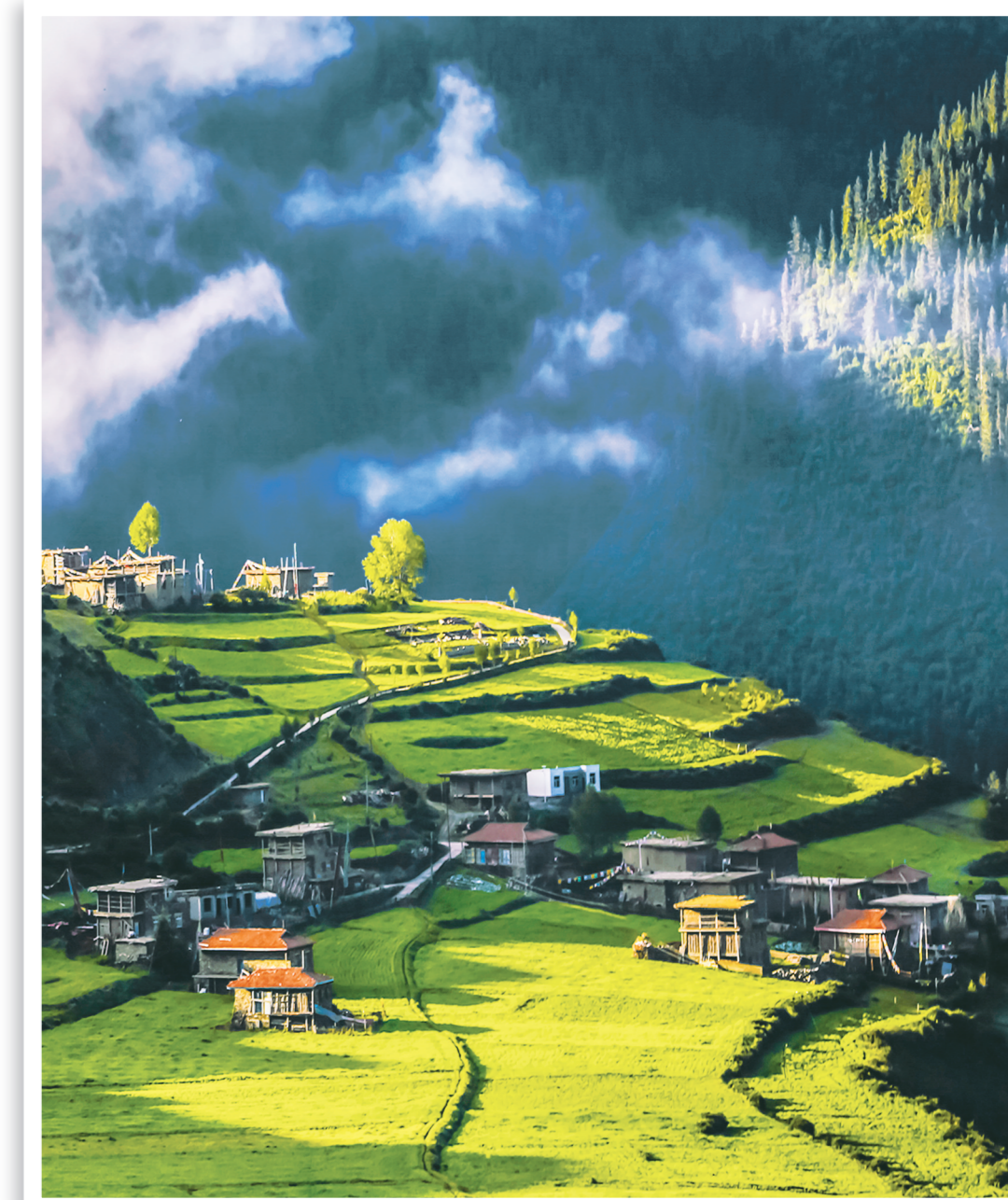
三色班玛,美丽家园。