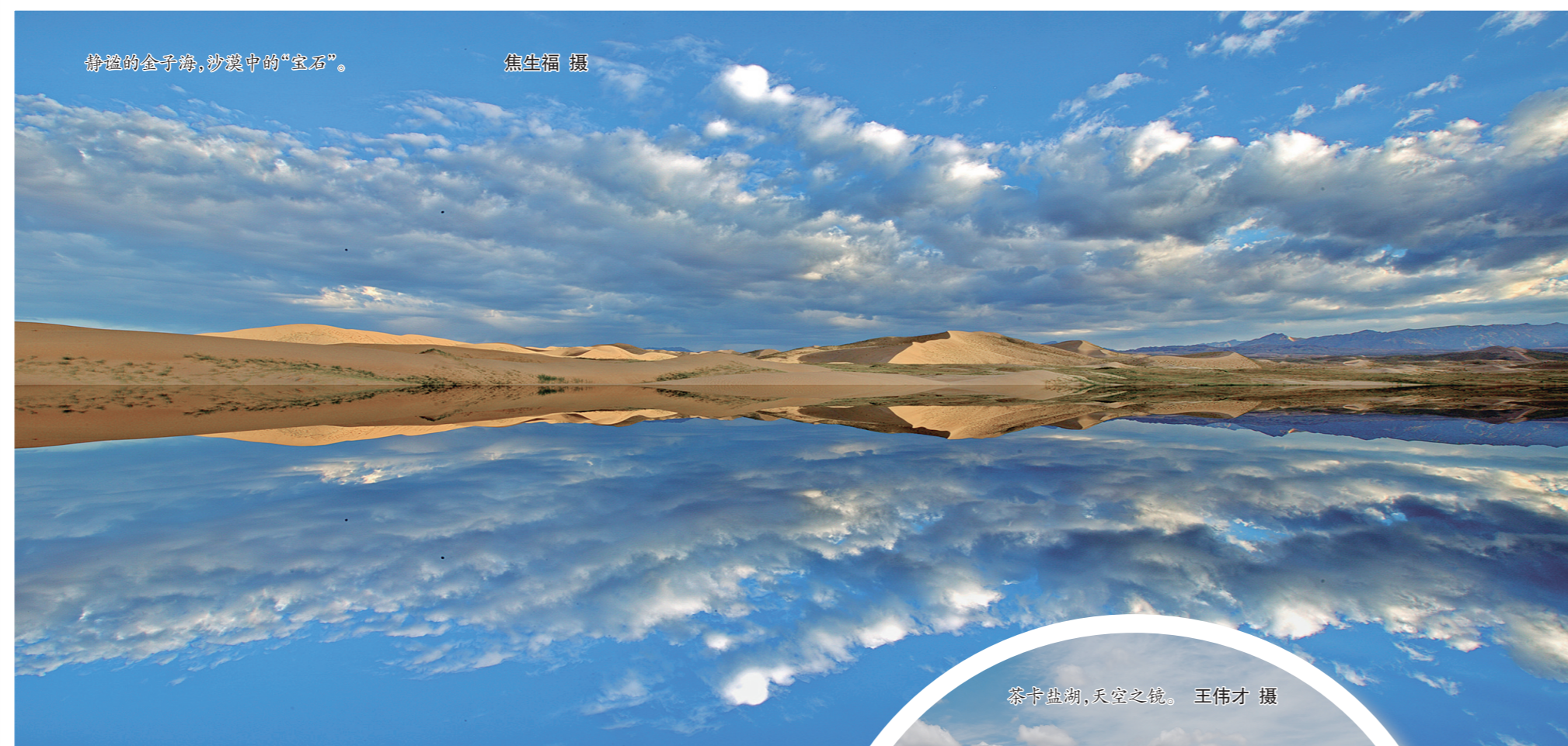
扮靓游客纷纷,沙漠中的“宝石”。