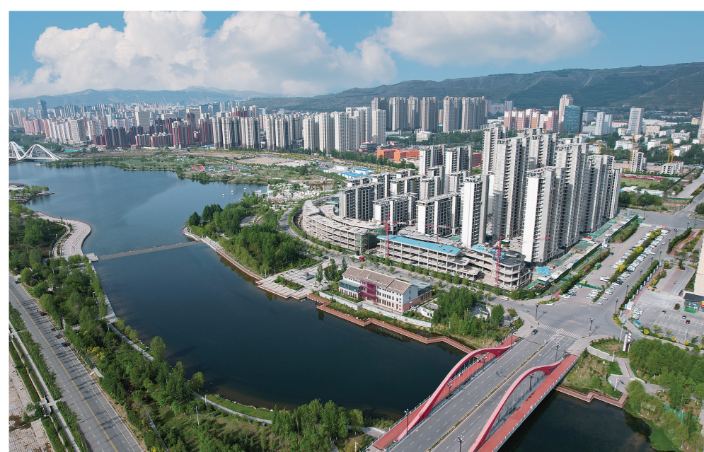
西宁北川河湿地公园,碧水清流入城来。