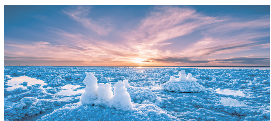
盐湖旅游,乘“热”而上。