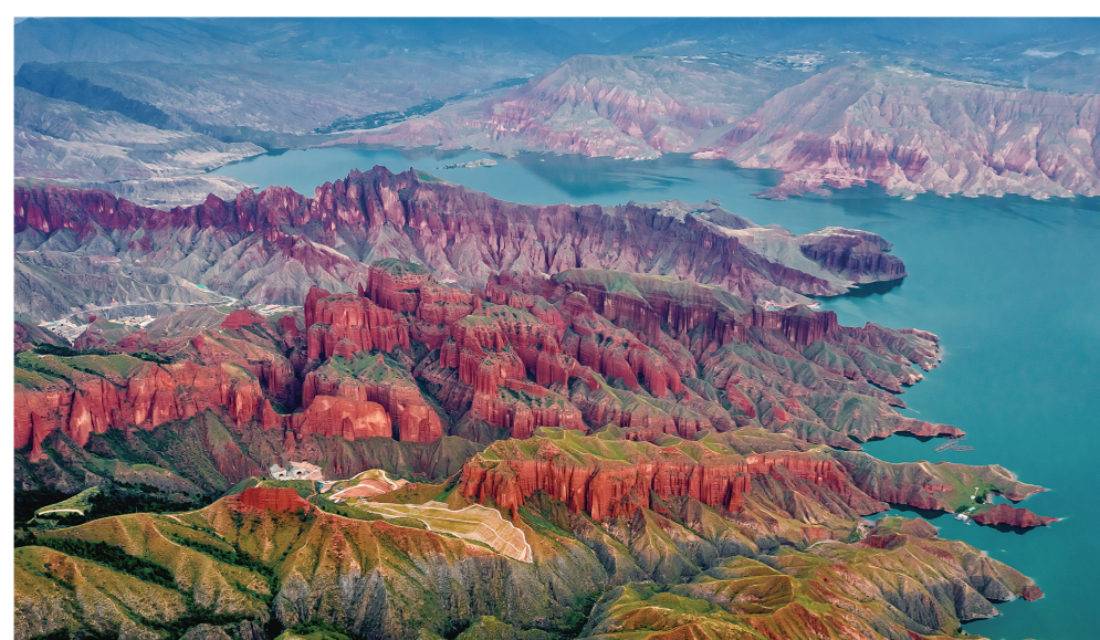
李家峡水库,丹霞红似火。

作为长江、黄河、澜沧江的发源地,青海切实担负起源头责任、干流担当,以智慧、力量,以辛勤、汗水,确保一江清水向东流,确保人与自然和谐相处,确保一方生态惠民生、惠子孙。