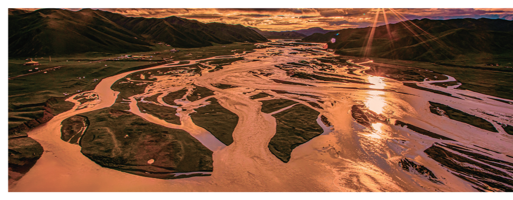
落日黄河,水天一色。