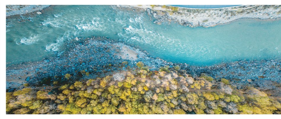
仙米林场,山涧小溪潺潺流。