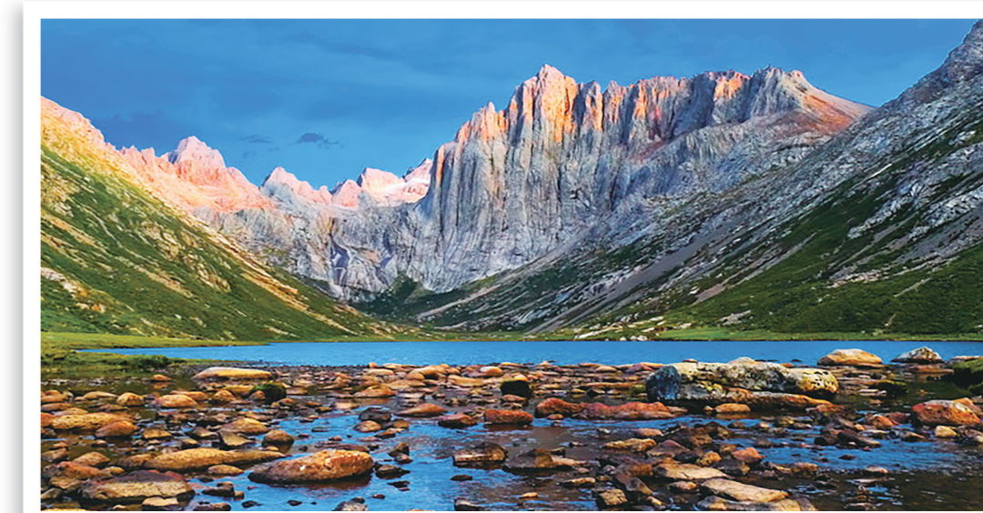
年宝玉则,人间仙境。