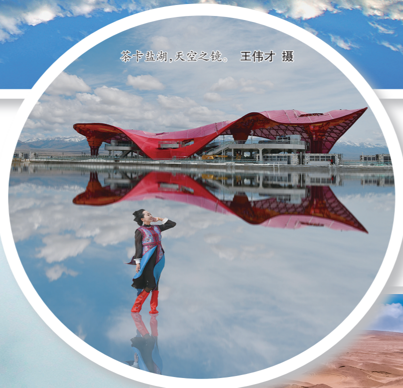
茶卡盐湖,天空之境。