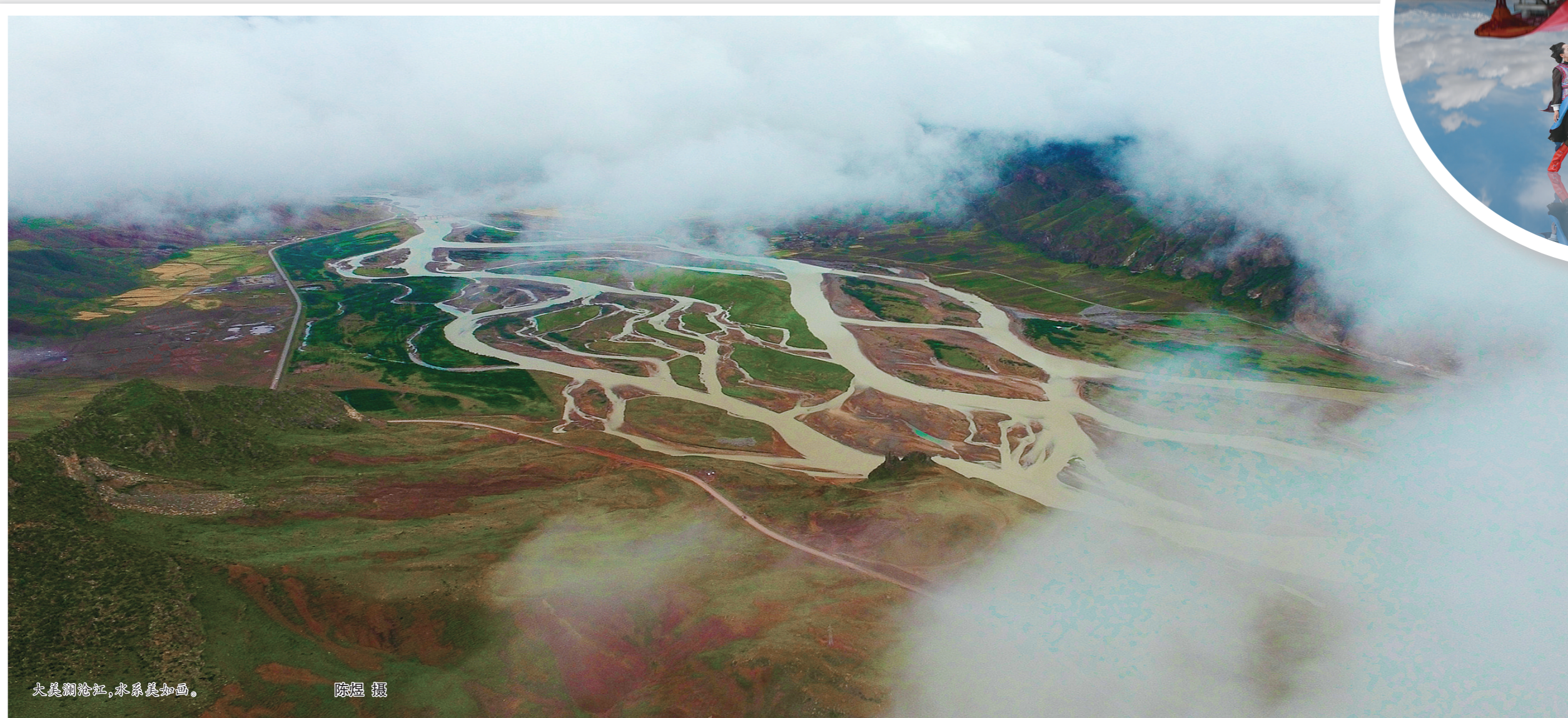
尖扎团结拉,水系具如画。