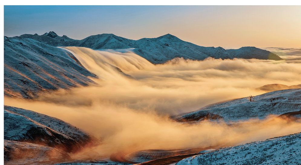
拉脊山日出,云腾霞蔚。