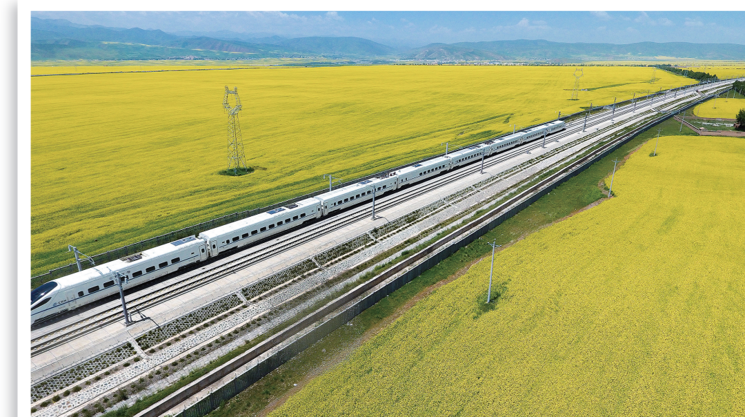
门源花海,扮靓高原。