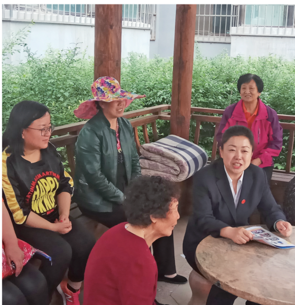
城中区礼让街街道解放路社区开展党群联席会议活动