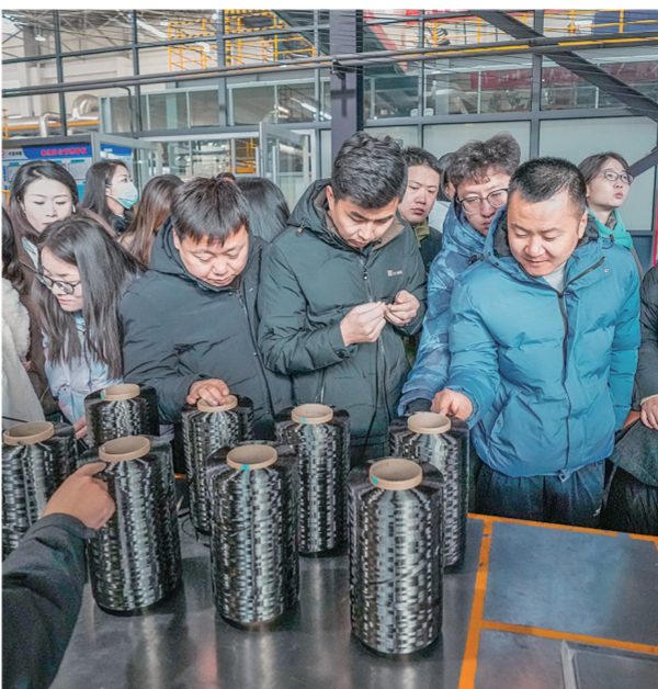
西宁市直机关工委开展“看西宁发展 看十佳单位”活动