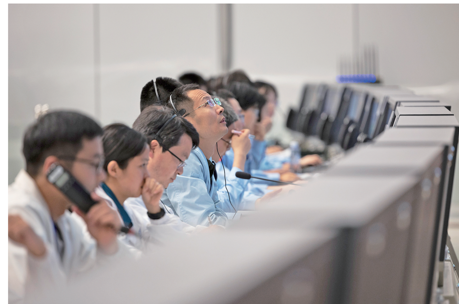
←6月2日,北京航天飞行控制中心工作人员在监测嫦娥六号着陆月背动态。

6月2日清晨,嫦娥六号成功着陆在月球背面南极-艾特肯盆地预选着陆区,开启人类探测器首次在月球背面实施的样品采集任务。