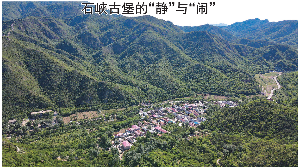
俯瞰石峡村(6月1日摄,无人机照片)。

北京市延庆区石峡村始建于明代,曾是居庸关北部的重要关口。近年来,石峡村依托长城资源,打造精品民宿,发展休闲农业等,迎接八方来客,逐步摸索出了一条乡村文旅发展新路径。因长城而建,因长城而兴,被群山环绕的静谧古村在新时代获得了新活力。