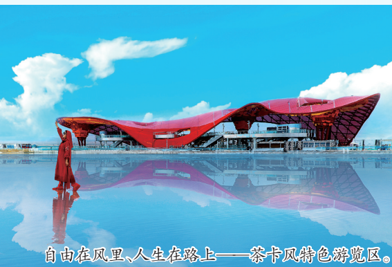
自由在风里、人生在路上——茶卡风特色游览区。