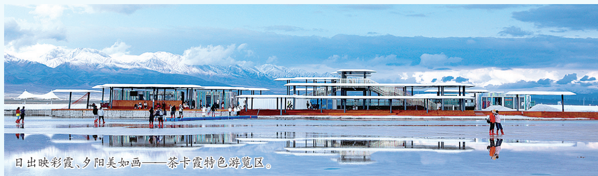
日出映彩霞、夕阳美如画——茶卡霞特色游览区。