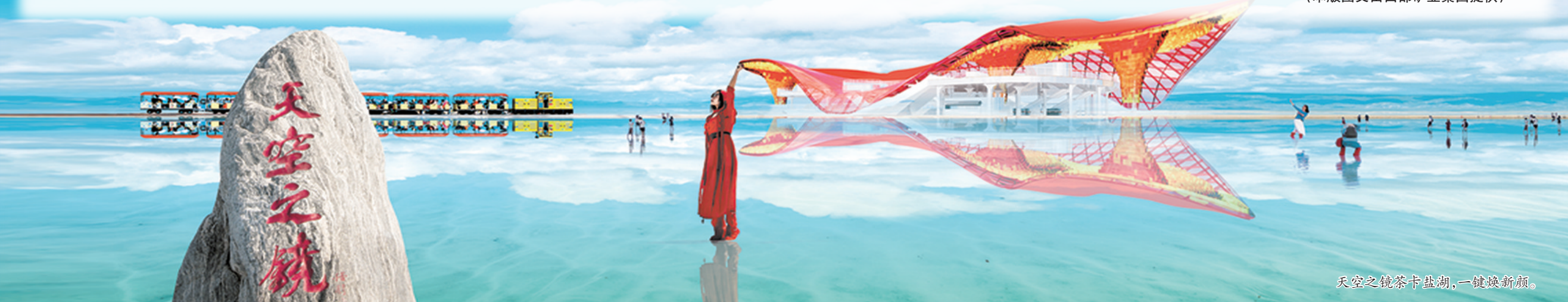
天空之境茶卡盐湖，一键焕新颜。