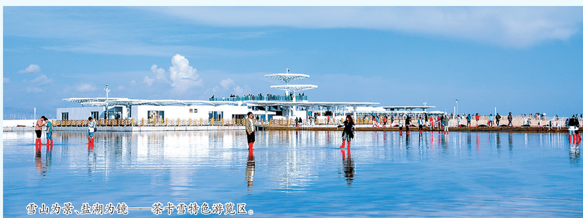
雪山为景、盐湖为镜——茶卡雪特色游览区。