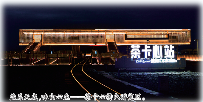
盐系天成，味由心生——茶卡盐特色游览区。