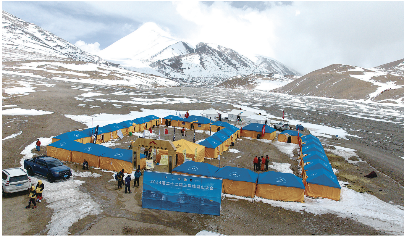
昂拉村玉珠峰登山大本营。