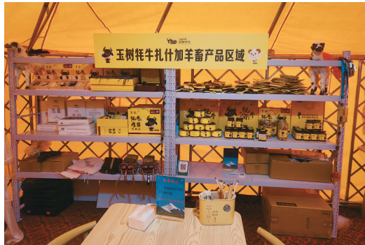
大本营里的畜产品体验店。

对此，昂拉村“两委”依托长江七渡口生态畜牧业专业合作社，与牧民签订租赁合同，整合牧民手中的优质草场，定期支付租赁费用，同时直接购买牧民的牛羊，再以