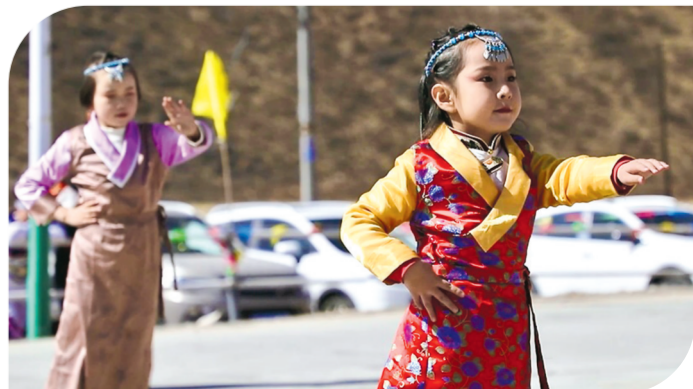
多才多艺的小演员。

3月12日,西宁市大通回族土族自治县宝库乡巴音村开展“宝库之韵·巴音牧民民俗文化”活动,全村男女老少身着民族盛装共同享受这场文化盛宴。