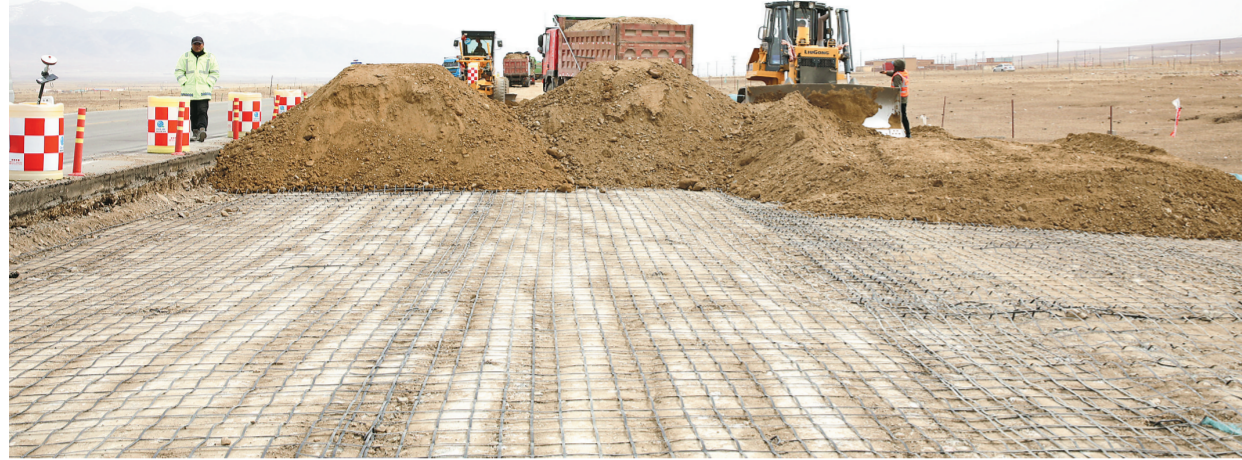
青海湖旅游公路(1期)项目施工现场。