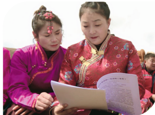
村民学习中央“一号文件”精神。