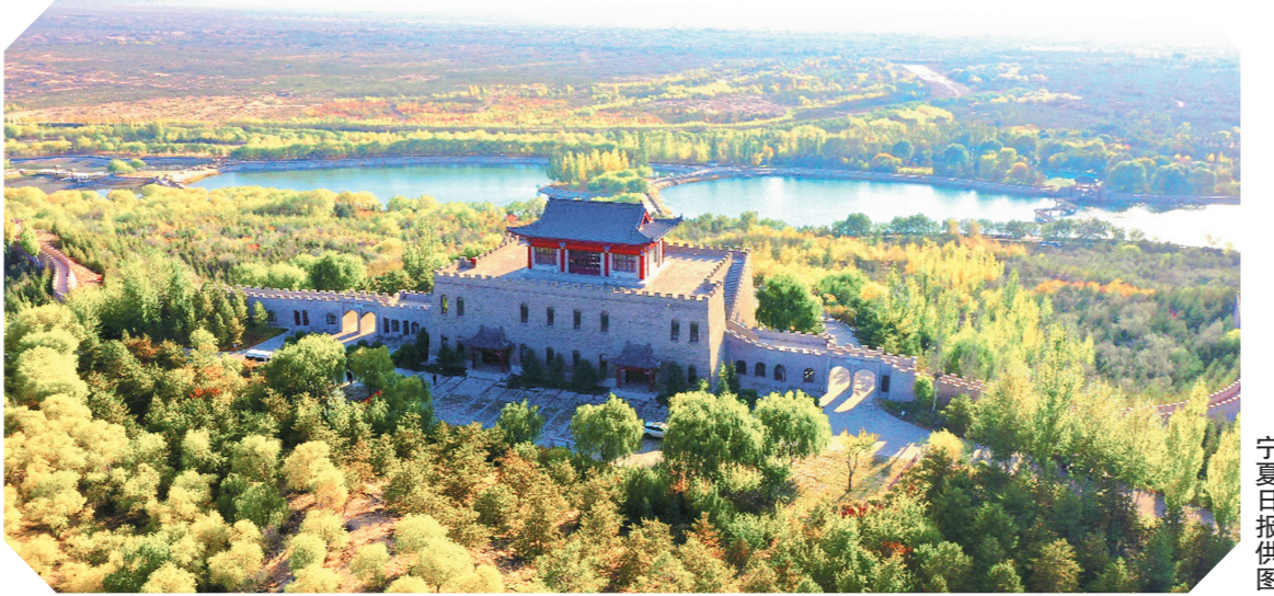
宁夏银川市白芨滩国家级自然保护区。

2024年是打好黄河“几字弯”宁夏攻坚战的重要一年。自治区林草局发挥国家林草局三北局驻地区优势，建立由省联合包抓工作机制，并由吴忠市、石嘴山市、鄂尔多斯市、榆林市、庆阳市4省区的5个地级市签署毛乌素沙地联防联控合作协议，起草黄河“几字弯”攻坚战片区5省区、腾格里沙漠4市联防联控框架协议，构建省市携手联防联控机制，合力攻坚战。随着区内5个地级市推进的相继举行，全区逐步形成横向协同、上下联动、齐抓共推的工作机制。有关数据显示，去年全年，全区完成营造林125.3万亩，草原生态修复28.2万亩，保护修复湿地20.9万亩。