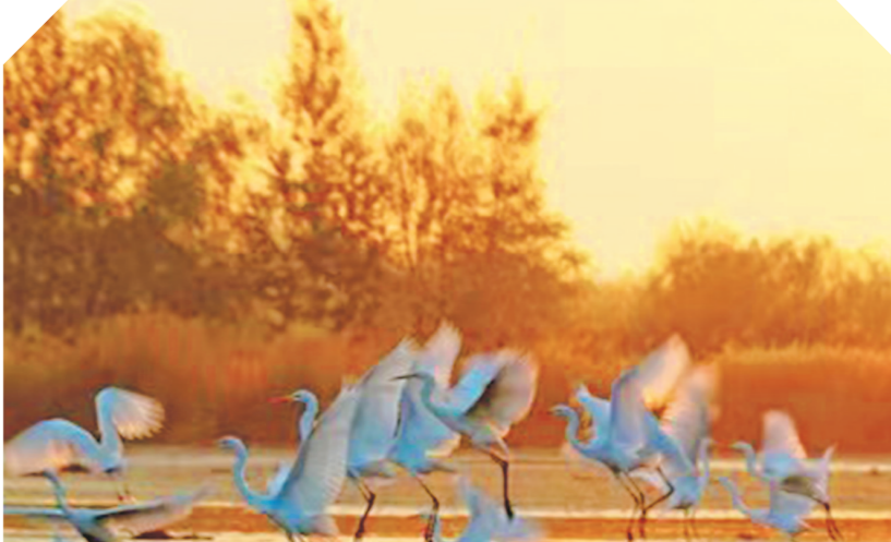
张旗国家湿地公园。

“今年春天，我们计划完成压沙造林1万亩，栽植各类沙生苗木300多万株。”郭万刚说，在政府部门和社会各界的大力支持下，梭梭、柠条等苗木和压沙所用的稻草都准备到位。 八步沙是古浪县北部的一个风口，“一夜大风沙骑墙，早上起来驴上房”曾是这里的真实写照。为了保护家园，20世纪80年代初，郭朝明等6位村民义无反顾地走进八步沙，以联产承包形式组建集体林场，在茫茫沙漠里艰难开启自治征程。 40多年来，以“六老汉”为代表的八步沙林场三代职工，在八步沙、黑岗沙以及北部沙区累计治沙造林28.7万亩，封沙育林育草管护面积扩大到43万亩，栽植各类沙生苗木6000多万株，完成退耕还林近200公里，农田林网5000多亩，以愚公移山精神书写了从“沙逼人退”到“绿进沙退”的绿色篇章。