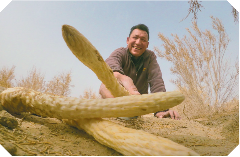
农民收获肉苁蓉。

柯柯牙绿化造林工程是新疆生态建设的标志性工程，1986年工程启动以来，阿克苏地区各族群众通过持续植树造林，完成造林面积120万亩，其中60%为经济林。当地群众通过发展苹果、红枣、核桃等林果种植，使阿克苏地区成为新疆林果业的主产区，林果产量占全疆四分之一，以苹果、核桃为代表的干鲜果品名扬全国。 新疆是我国荒漠化及沙化面积最大、分布最广、危害最严重的省区，荒漠化土地面积达106.86万平方公里，占国土面积的64.18%。1978年我国启动“三北”防护林工程以来，新疆各族群众依托“三北”防护林工程接续奋斗，累计完成人工造林保存面积2275.72万亩，森林覆盖率由1.03%提高到目前的5.05%，使风沙危害和水土流失得到有效控制。