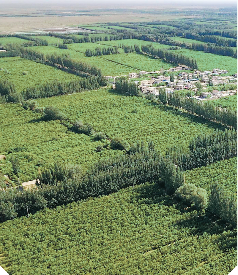
新疆巴音郭楞蒙古自治州若羌县红杏林（6月3日无人机拍摄）。