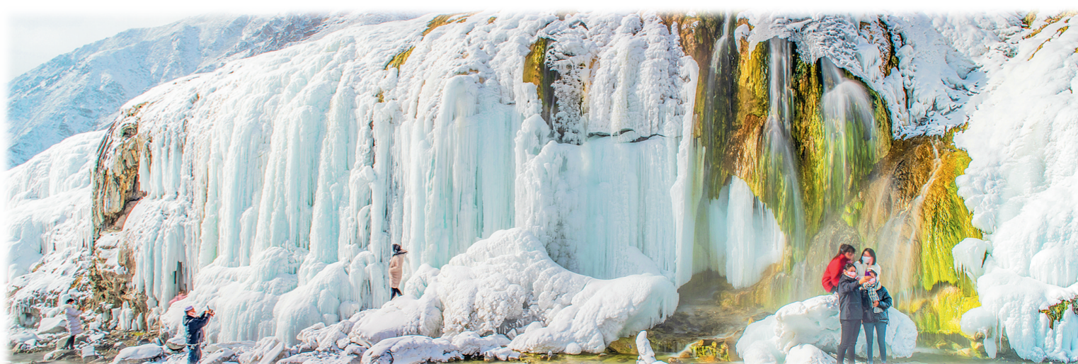
游客在七彩瀑布下拍照留影(拍摄于海北藏族自治州门源回族自治县)。