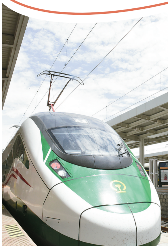
“复兴号”开上西格段,青藏铁路进入动车时代。

翻开2024年青海省《政府工作报告》,看到的是过去一年一个个亮眼成绩单:经济波浪式发展、曲折式前进,全年经济运行呈现前高、中扬、后稳态势,总体回升向好……全省经济在风浪中强健了体魄、壮实了筋骨,发展韧性和后劲显著增强。