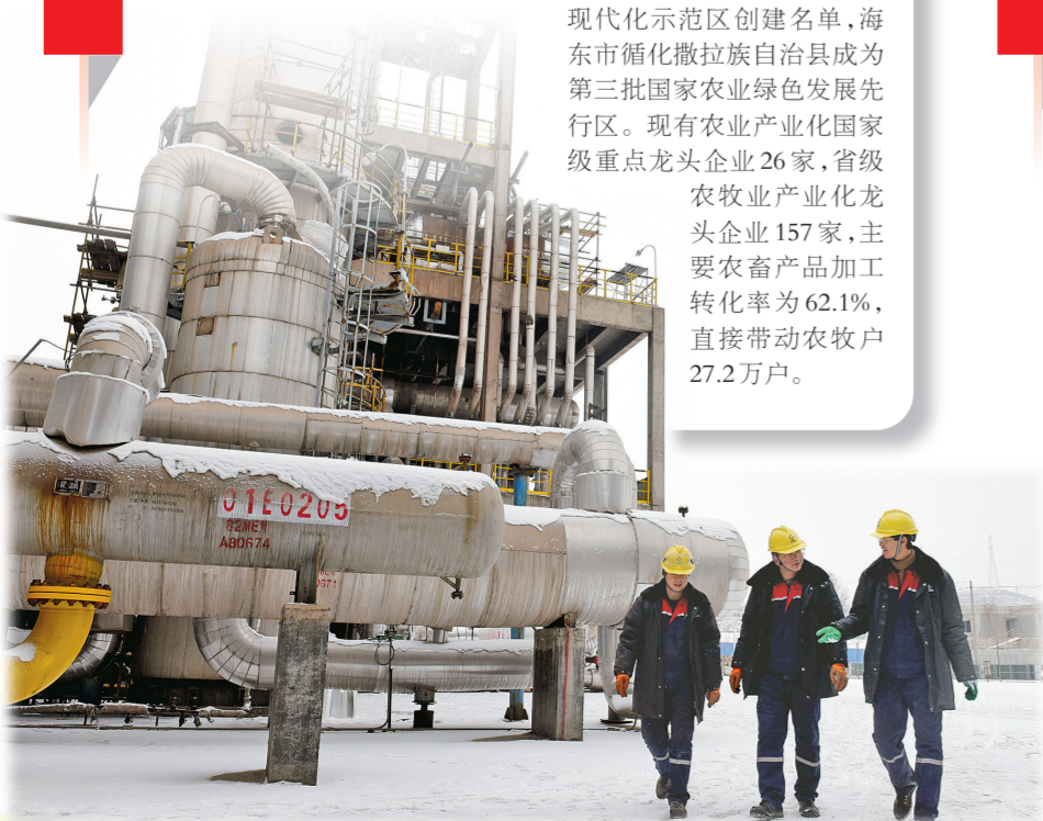
青海云天国际化肥有限公司里,工人们忙碌的身影随处可见。

凝心聚力谋发展,乘风破浪勇向前。青海将以更有力的举措推动经济发展在“量”和“质”上不断突破提升,迈着坚定的步伐,为实现高质量发展打开更加广阔的空间。