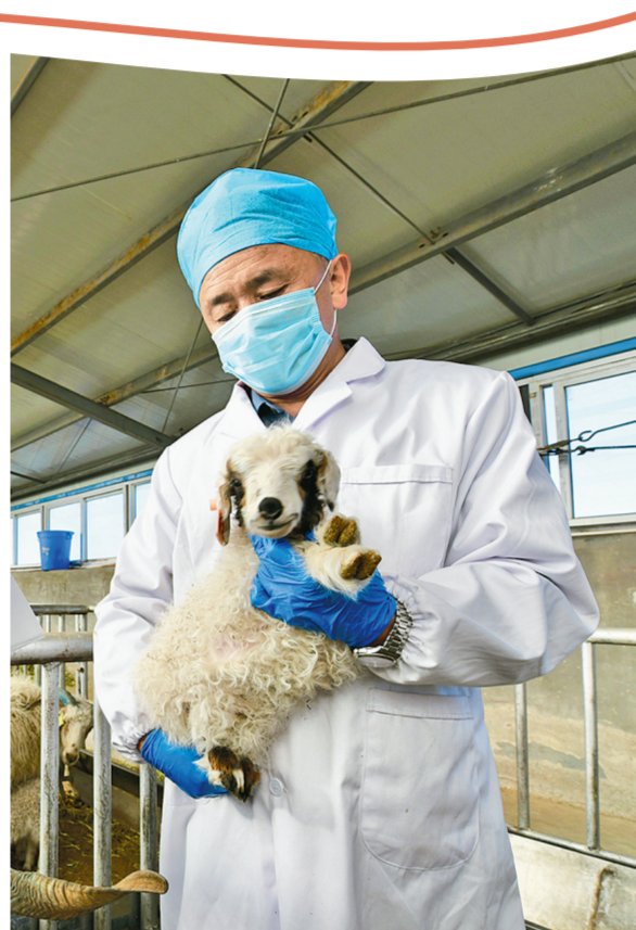
海北藏族自治州高原生态畜牧业科技示范园开展的