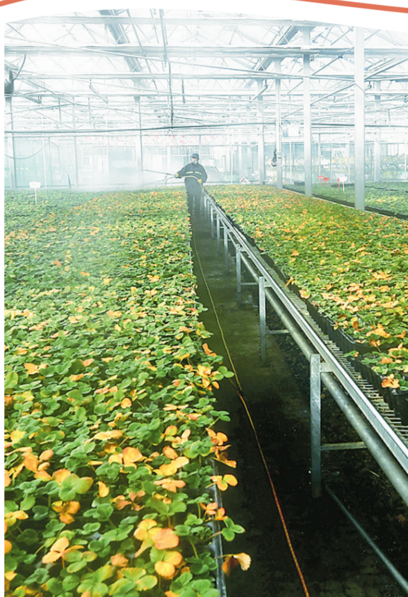
西宁市湟中区多巴镇玉拉村的大棚内果蔬长势喜人。