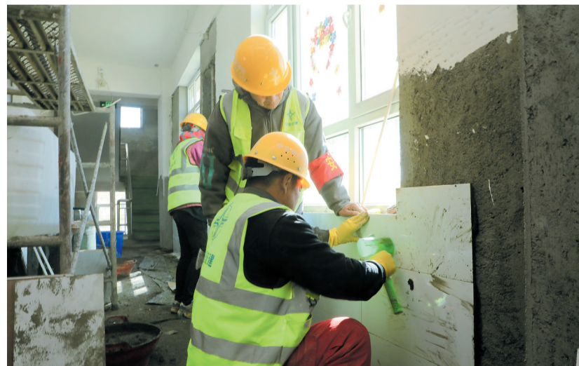
灾后恢复重建作业现场。