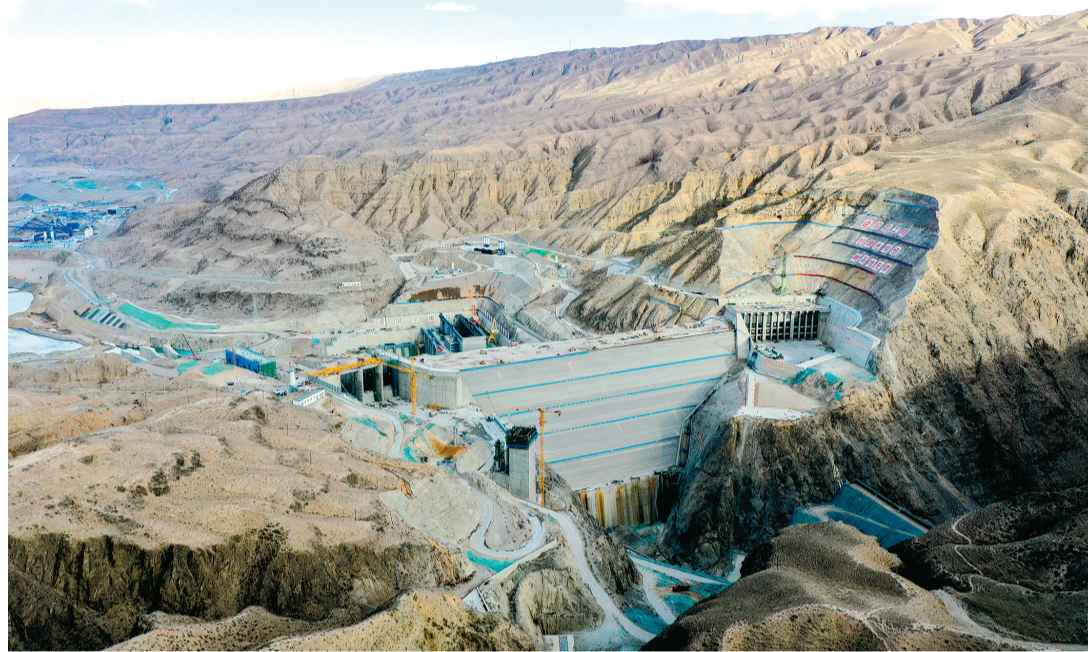
▲羊曲水电站全景。